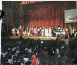
Copiii s-au întrecut în prezentarea celor mai frumoase costume inspirate din personaje de povești

Festivitatea de premiere s-a încheiat, ca în fiecare an, cu o frumoasă paradă a costurilor reprezentând personaje din poveștile aflate în concurs după acordarea diplomelor din partea juriului pentru cele mai reușite costume.