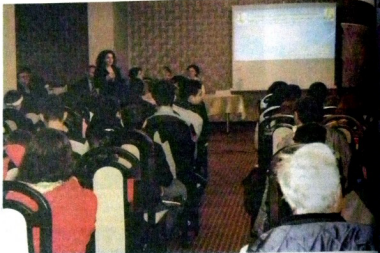
Elevii au aflat ieri care este regulamentul concursului

Concursul „Citești și câștigi” și-a prezentat ieri regulamentul, dar și recompensele ce vor fi acordate câștigătorilor în cadrul unui eveniment ce a avut loc la Deva Mall. De față au fost profesori, dar și elevii a opt licee din Deva care vor lua parte la competiție, însoțiți și încurajați de inimoase galerii. Să citească, să acumuleze cunoștințe pe care să le folosească apoi când vor răspunde unor întrebări adresate de un juriu, cam asta trebuie să facă competiții în următoarele cinci luni. Ce au de câștigat, la sfârșit, în afară de o solidă cultură generală: tablete, trofee, o bicicletă și o cameră video, dar și o grămadă de cărți.