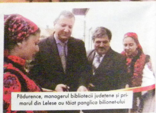
Pădurence, managerul bibliotecii județene și primarul din Lelese au tăiat panglica bilionet-ului

Dotarea comunei Lelese cu un centru Biblionet face parte din etapa a cincea de implementare a