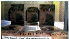
Volumul de poezii „Iubire” a fost prezentat publicului