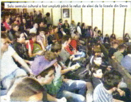
Sala centrului cultural a fost umplută până la refuz de elevi de la liceele din Deva

Manifestarea a început cu un moment artistic susținut de elevii claselor a VIII-a și a XI-a ale Colegiului Tehnic „Transilvania” din Deva sub îndrumarea profesora-