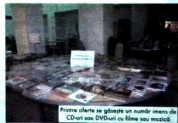
Printre ofertele se găsește un număr imens de CD-uri sau DVD-uri cu filme sau muzică

geri p e n - tru toate nivelele de învățământ, dicționare diverse și enciclopedii. Potrivit organizatorilor, de la acest salon nu va pleca nimeni nemulțumit pentru că, toate categoriile de vârstă vor găsi cărți care să le satisfacă gusturile și aria de interes.