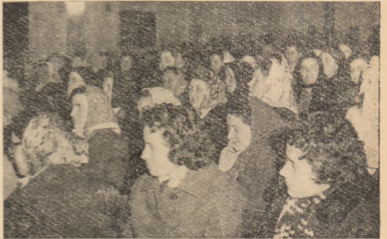
Aspect de la Conferința raională a femeilor.

Făcînd bilanțul rezultatelor bune obținute, Conferința n-a trecut însă cu vederea lipsurile manifestate în munca comisiilor și comitetelor raional și comunale.