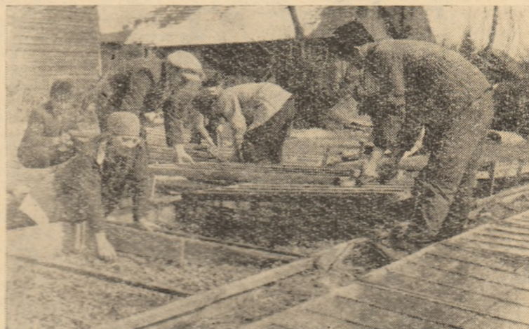
Colectiviștii din Teiuș, care în acest an cultivă legume pe o suprafață de 25 hectare, au luat din vreme măsuri pentru asigurarea răsadului necesar.