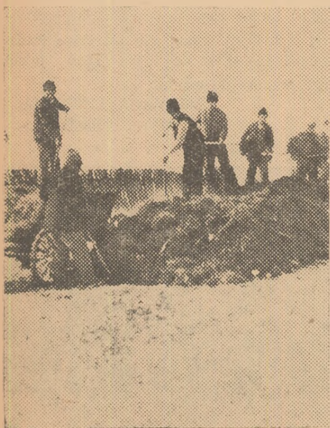
Colectivizii aranjează gunoiul în platformă pentru încălzire, în vederea pregătirii paturilor calde pentru răsădnițe.