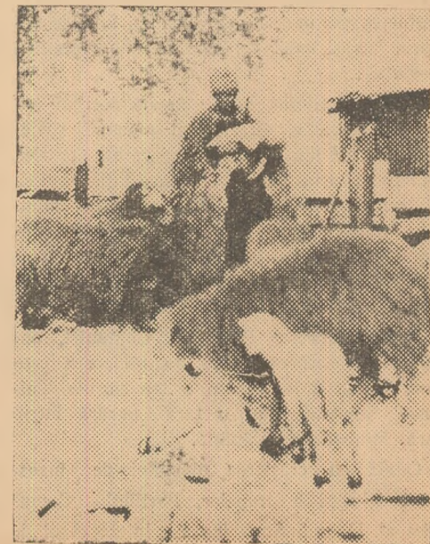
Primii miei în gospodăria colectivă.

Exemplul lor în muncă face să sporească și mai mult rodul colectivului. Acum colectivizii romîni și maghiari din Căpuș privesc cu încredere viitorul, a cărui zori ei le-au văzut în urmă cu 4 ani. Drumul înfrățirii și al belșugului, constituie calea pe care ei pășesc zi de zi cu încredere.