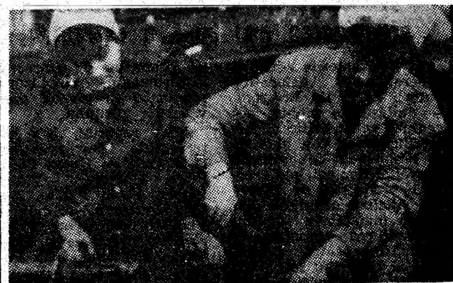
În atelierul reparații combine al IM Lupeni.

Adunarea generală s-a încheiat cu aprobarea unanimitate a angajamentului ca pînă la începerea lucrărilor marului forum al comunistilor din acest an, colectivul de oameni ai muncii de la mina Dilja să raporteze realizarea și depășirea planului de producție.