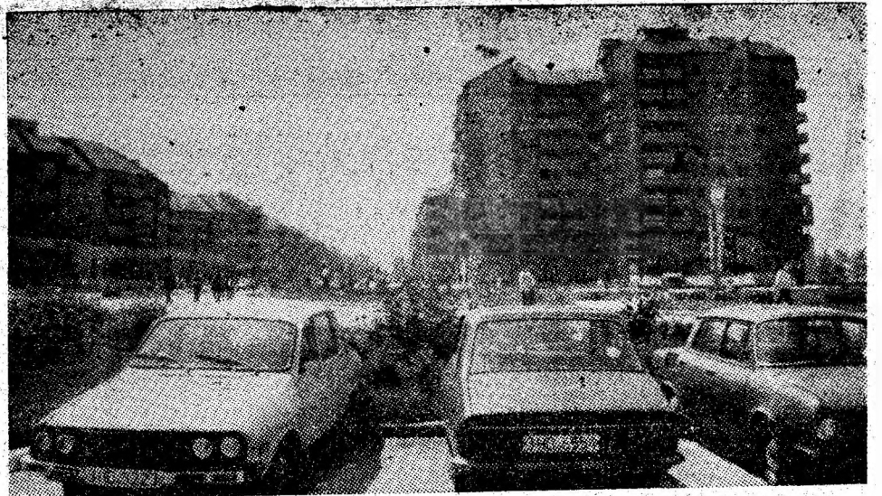
Petroșani-Nord. Siluete arhitectonice moderne în consens cu prafacerile petrecute în acești ani în reședința de municipiu.