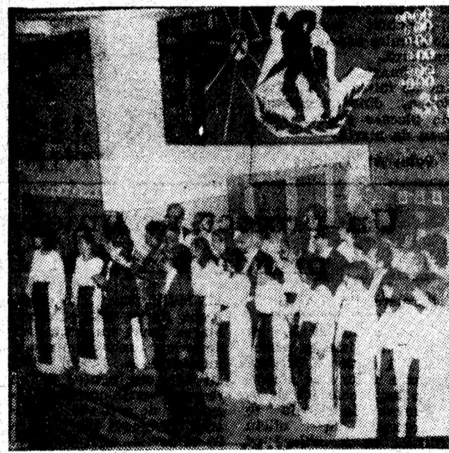
Formația corală „Madrigal” în mijlocul minerilor din Uricani.