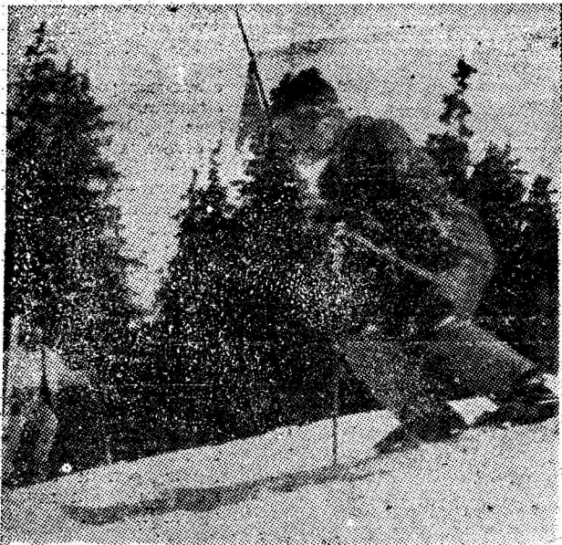
În slalom viielos, printre portii.