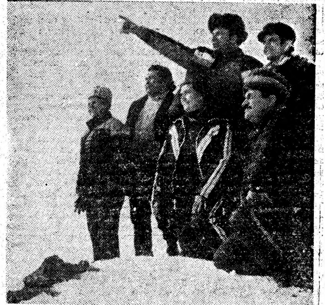
Galerie activă, pe virf de troiene.