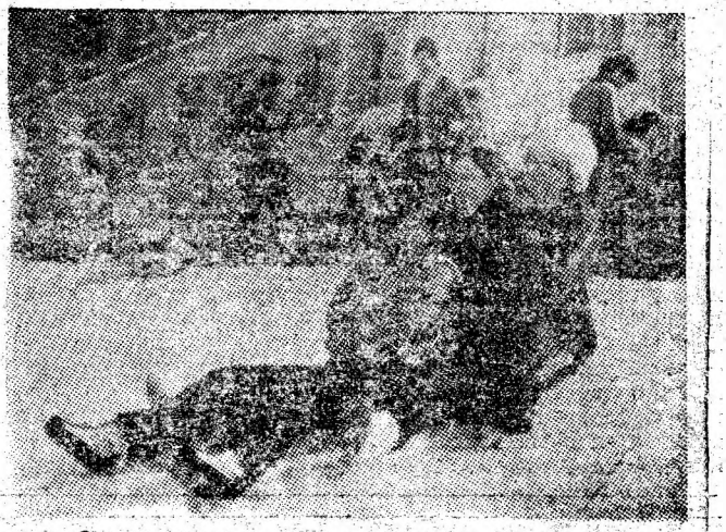
„Ciorchine” alunecător pe buclușoa pungă de plastic.