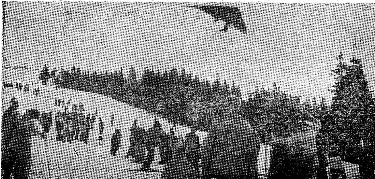
Emoție generală pe pirtie : trece în zbor Romeo Roșu cu deltaplanul I