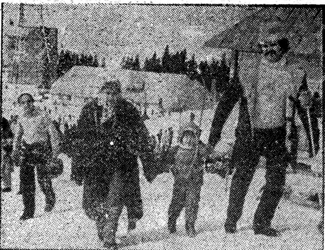
„Bunica, tătucul și eu..”