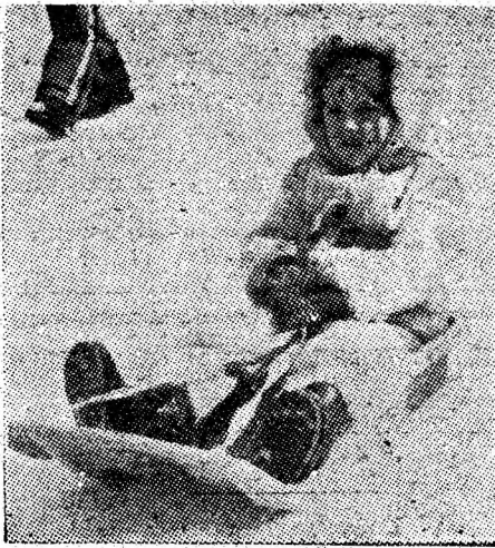
Fiecare cu „vehicolul” preferat.