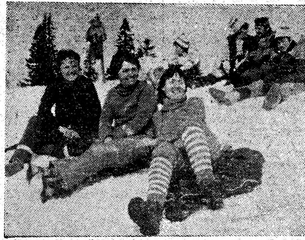
Mult soare și zîmbete pe albul strălucitor al zăpezii.