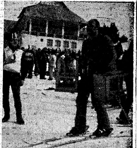
Cu tot „mobilierul” în mișcare.