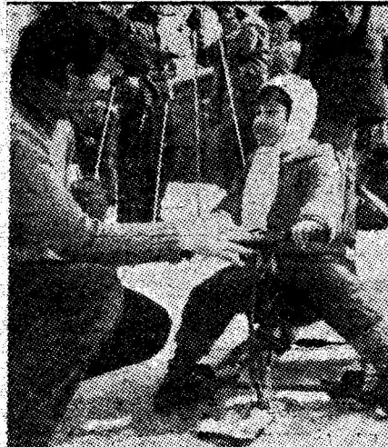
La virsta cind sfaturile prind bine...