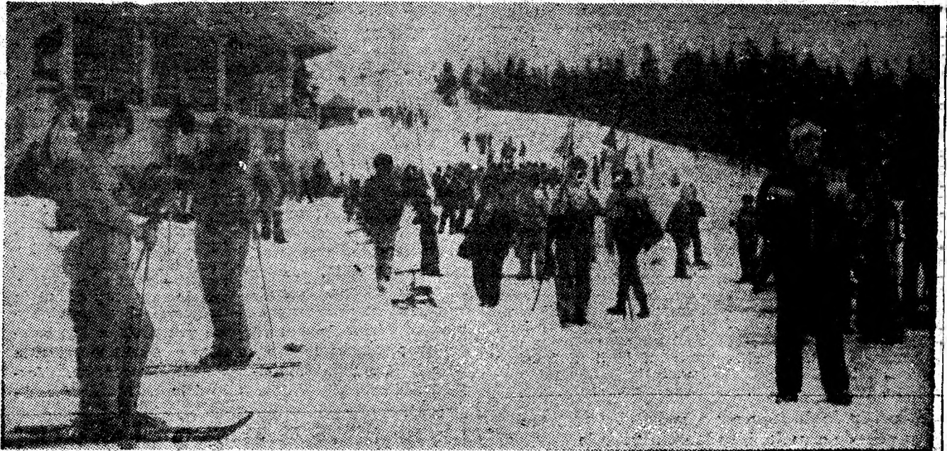
Animatie de zile mari pe pirtia bazelor didactice din Parîng.