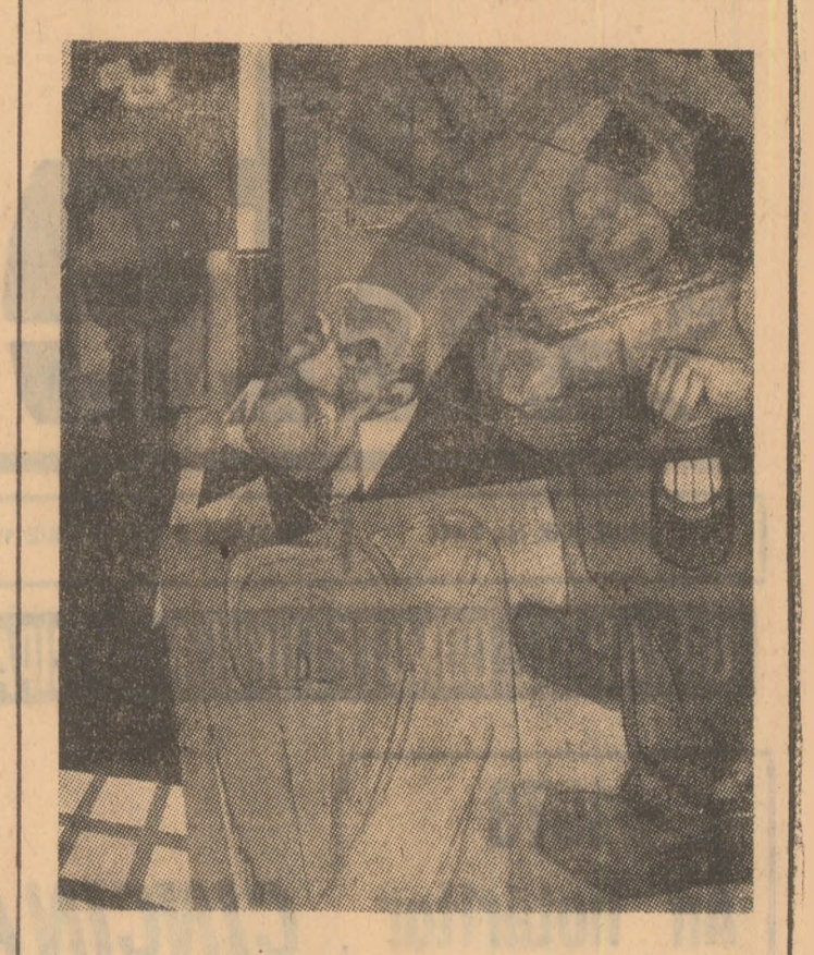
Ion Cirjoi — Epilog 1929 Pictură ulei. Prezentă la expoziția artiștilor plastici de la Casa de Cultură din Petroșani.

Expoziția de artă plastică este un bun prilej pentru a observa procesul de creație al artiștilor grupai în cîteva filiale și cenacului (Craiova, Deva, Hunedoara, Petroșani). Analizînd și comparînd stilurile, modalitățile expresive, tematicile și influențele ajungem la concluzia că actuala expoziție este un eveniment în cel mai bun înțeles al cuvîntului, cu inevitabile inegalități și imperfecțiuni. Dacă sculptura, grafica și tapiseria ocupă un spațiu restrîns, pictura, în schimb, este bogat reprezentată, impunînd și suficiente elemente de individualizare a grupurilor artistice. Alături de portrete și peisaje se expun multe tablouri de compoziție, din toate degajîndu-se gîndirea și sensibilitatea artiștilor, capacitatea de emoționare. Deși deschișă în cadrul festivalului culturii și educației socialiste „Sarmis '73”, această ediție avînd ca temă dominantă folclorul în multiplele sale ipostaze, deci și în arta plastică, expoziția are o tematică eterogenă, lăsînd impresia că fiecare expune ceea ce crede, fără a se fi procedat la o selecție prealabilă pentru a se impune, într-un fel oarecare, o ordine, o grupare, îie determinate de criterii extra-artistice (filialele în care se află cuprînsi expoziții), fie artistice. Fenomenul artistic creațiv, apreciat după lucrările expuse, are o mediocritate ce iese în evidență și mai mult prin contrast cu celelalte