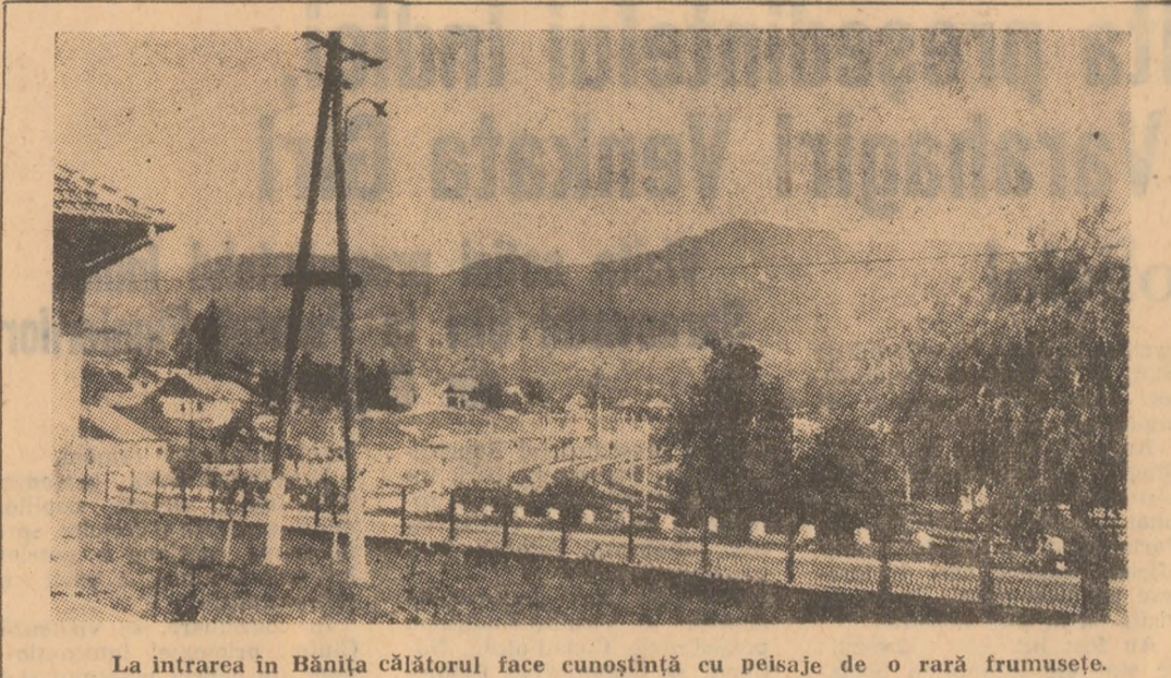
La intrarea în Bănița călătorul face cunoștință cu peisaje de o rară frumusețe.

În cartierul Aeroport. Vin elevii de la școală.