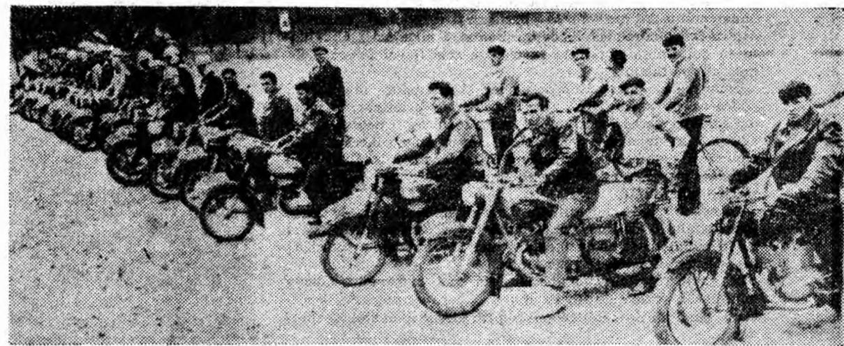
Instantaneu de la sosirea pe stadionul din Petroșani a ștafetelor sportivilor din Valea Jiului cu mesajele de salut adresate Congresului partidului.

Comportîndu-se bine, campionii republicani pe echipe din anii 1963 și 1964 au reușit să cucerească nu mai puțin de 5 titluri de campioni regionali. Iată cîștigătorii pe cate-