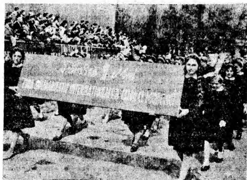
Demonstrează un grup de eleve din Petroșani.