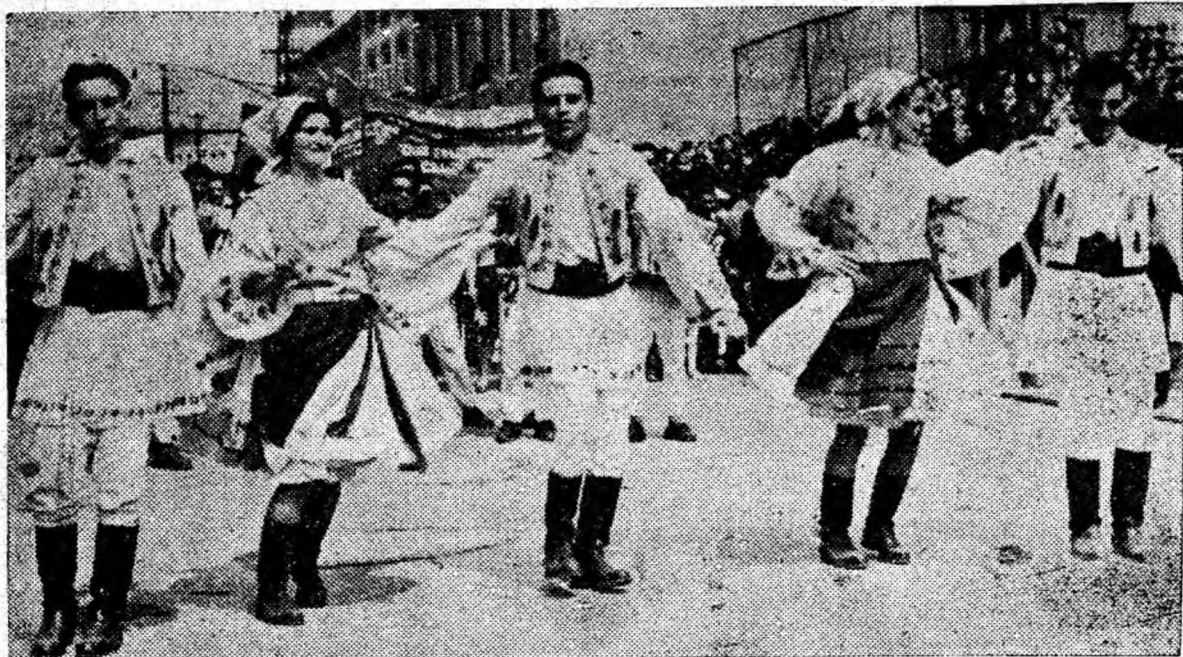
o formație de dansuri executînd în fața tribunei un joc popular de pe platurile regiunii noastre.