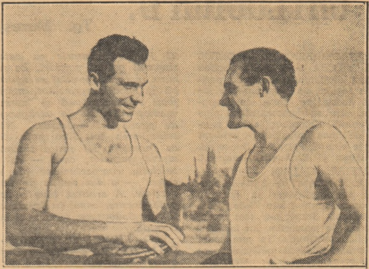
Din anul 1965, numele cunoscutului atlet cehoslovac Ludvik Danek figurează pe lista recordmanilor mondiali, el detinînd și azi supremația în aruncarea discului cu performanța de 65,22 m. Iată-l pe Danek (stînga) în compania antrenorului său, Jan Vrabel