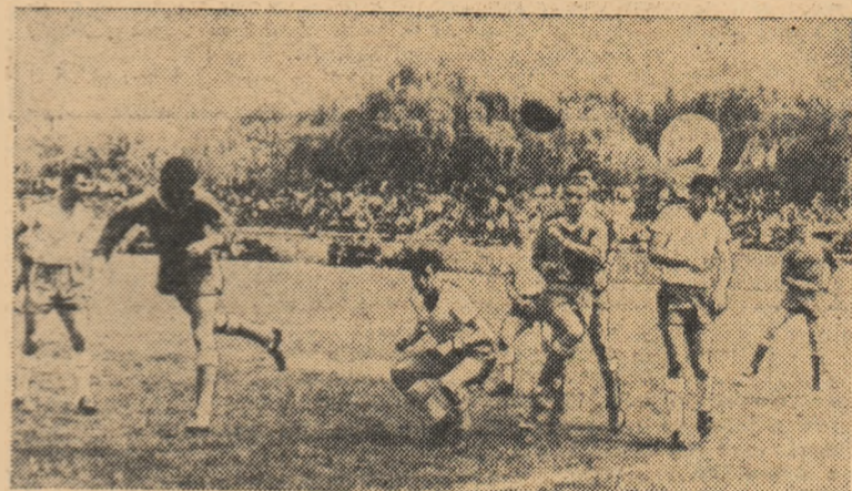
Unul dintre atacurile studenților la poarta formației Dinamo Victoria (fază din meciul Dinamo Victoria—Politehnica București).

OȚELUL GALAȚI — CEAH-LĂUL P. NEAMȚ 0—2 (0—1). Meciul s-a desfășurat la Focșani, deoarece terenul din Galați este suspendat. Jocul n-a fost spectaculos, la nereușita lui aducîndu-și... contribuția, în mai mare măsură, fotbalistii gălățeni, care s-au prezentat slab pregătiți. Trebuie să arătăm, de asemenea, că în urma ploii terenul a fost des-