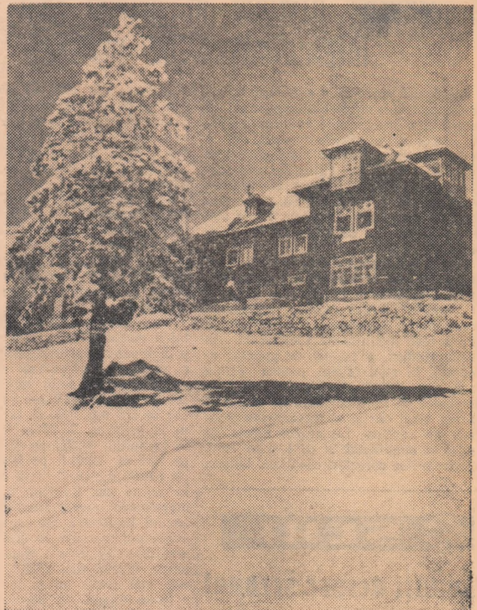
Cristianul Mare... În aceste zile, frumoasa cabană este și mai mult vizitată pentru că se află la... doi pași de pîrtia Kanferului, unde zăpada oferă amatorilor de schi condiții excelente.