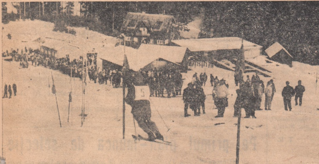
O frumoasă imagine de la concursul de deschidere desfășurat anul trecut la Predeal Unde o vom revedea anul acesta?