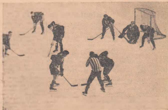
Fază din meciul S.S.E. nr. 2—Constructorul II disputat ieri... pe ploaie

Campionatul tinerilor hocheiști bucureșteni continuă după următorul program: AZI: de la ora 16,30: Dinamo—S.S.E. nr. 2, Steaua—Olimpia; MÎINE de la ora 16,30: Dinamo—Constructorul II, Steaua—S.S.E. nr. 2,