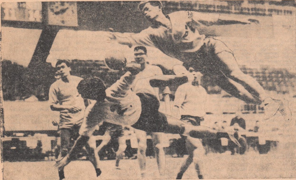
Handbalul câștigă numeroși admiratori și în îndepărtata Japonie. Iată o fază animată a unui meci recent din cadrul campionatului japonez.

■ INCEP SFERTURILE DE FINALA IN „C.C.E.” ■ ARBITRII MECIURILOR R.I.K. GÖTEBORG — DINAMO BUCUREȘTI ■ PRIMELE REZULTATE DIN CAMPIONATUL MONDIAL UNIVERSITAR DE LA MADRID ■ JOCURILE INTER-ȚĂRI DIN LUNA IANUARIE.