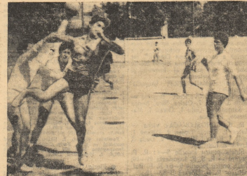
Fază din partida Confecția — Progresul (15—5).

Jucările feminine continuă astăzi, tot pe terenul Progresul, de la ora 16,30, după programul următor: Elec- tromagnetica — Progresul și Știința — Rapid.