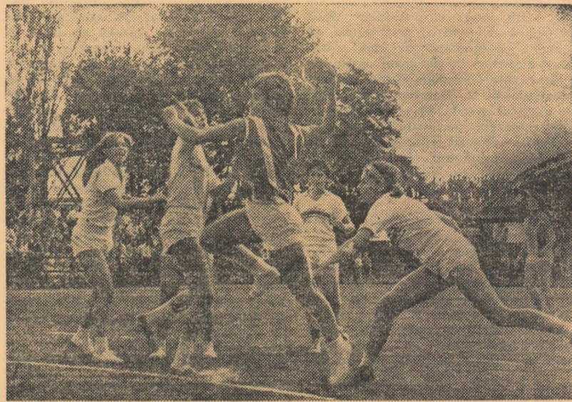
Fază din meciul Rapid - Progresul