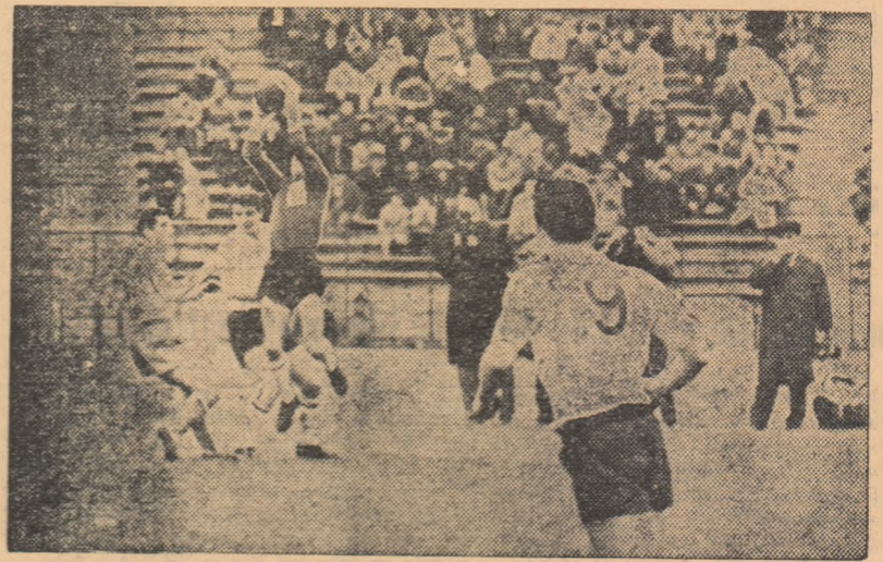
Portarul englez Bonetti reține o minge înaltă

Partida începe cu cîteva minute „de studiu”, în care se joacă mai mult la mijlocul terenului. Prima acțiune de poartă mai importantă se înregistrează în min. 8 cînd Crăiniceanu centrează din apropierea liniei de fund dar mingea trimisă de el spre punctul de 11 metri nu găsește nici un partener. În min. 14 Dobson ne dă emoții, reluînd spectaculos, printr-o „foarfecă”, de la cîteva metri, în bară! Obținem apoi cîteva cornere, mulțumită aripei Dumitriu II — Matei. Atacul nostru combină frumos dar nu încearcă îndeajuns poarta, deși beneficiază de avantajul vîntului. Englezii răspund prin joc simplu, bazat pe lansări lungi ale extremelor. În min. 28, Bonetti reține o lovitură liberă executată de Crăiniceanu, apoi — după un minut — la un șut al lui Matei prinde, scapă și reîncepe balonul. Suciul își anunță seria intervențiilor salvatoare, plonjînd curajos, în min. 32, la picioarele lui Hill. În minutul 35 se înscrie singurul gol al meciului. Adam, în poziție bună, este faultat la 20 de metri de poartă. Matei execută lovitură liberă cu efect, pe lângă zid, și mingea se oprește în