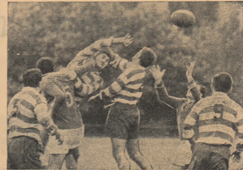
Aspect din partidă Steaua — Dinamo