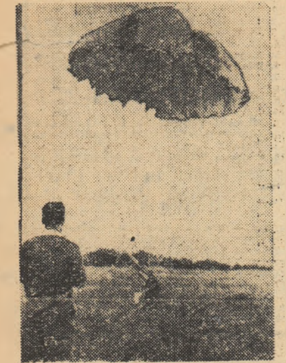
Aterizările parașutiștilor au fost urmărite cu mult interes de spectatorii marii demonstrații aviatice de pe aerodromul Băneasa