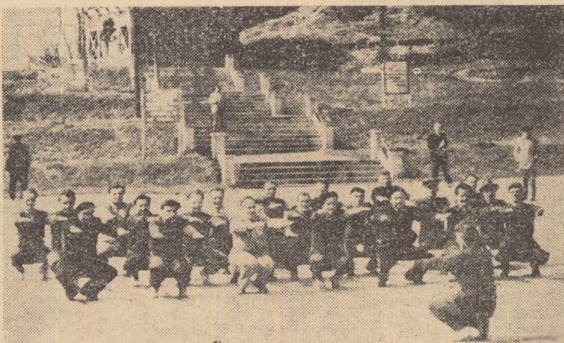
Gimnastica de înviorare este strîns legată de activitatea zilnică a oamenilor muncii veniți la odihnă la Singeorz-Băi, așa cum se vede și în fotografie

Intr-una din cele mai pitorești regiuni ale țării, la poalele munților Rodnei, pe valea riului Borcut se află localitatea Singeorz-Băi. Stațiunea se bucură de un frumos renume datorită izvoarelor sale de ape minerale alcaline, bicarbonate (cloruro-sodice, feruginoase, carbogazoase) și radioactive, indicate pentru boli de stomac, intestine și ficat.