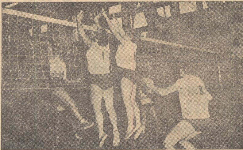
Fază din meciul Dinamo — Farul (3—0)

BUCUREȘTI: Rapid — Țesătura Iași 3—0 (4, 0, 9). Echipa bucureșteană a reușit o victorie categorică în fața unui adversar timorat și total lipsit de inițiativă. Cea mai bună jucătoare a învinselor a fost Paula Pislaru. (E. Filip — coresp.)