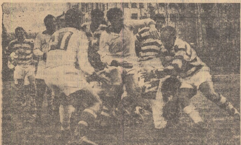
Posmoșanu a încercat să pătrundă din margine prin linia dinamovistă, dar el a fost oprit printr-un placaj sec (C.F.R. — Dinamo: 13—0).