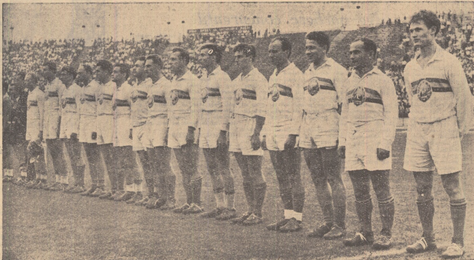
Echipa de rugbi a R. P. Române care a învins ieri renumita reprezentativă a Franței

Ediția a XII-a a Campionatelor internaționale ale R. P. R.