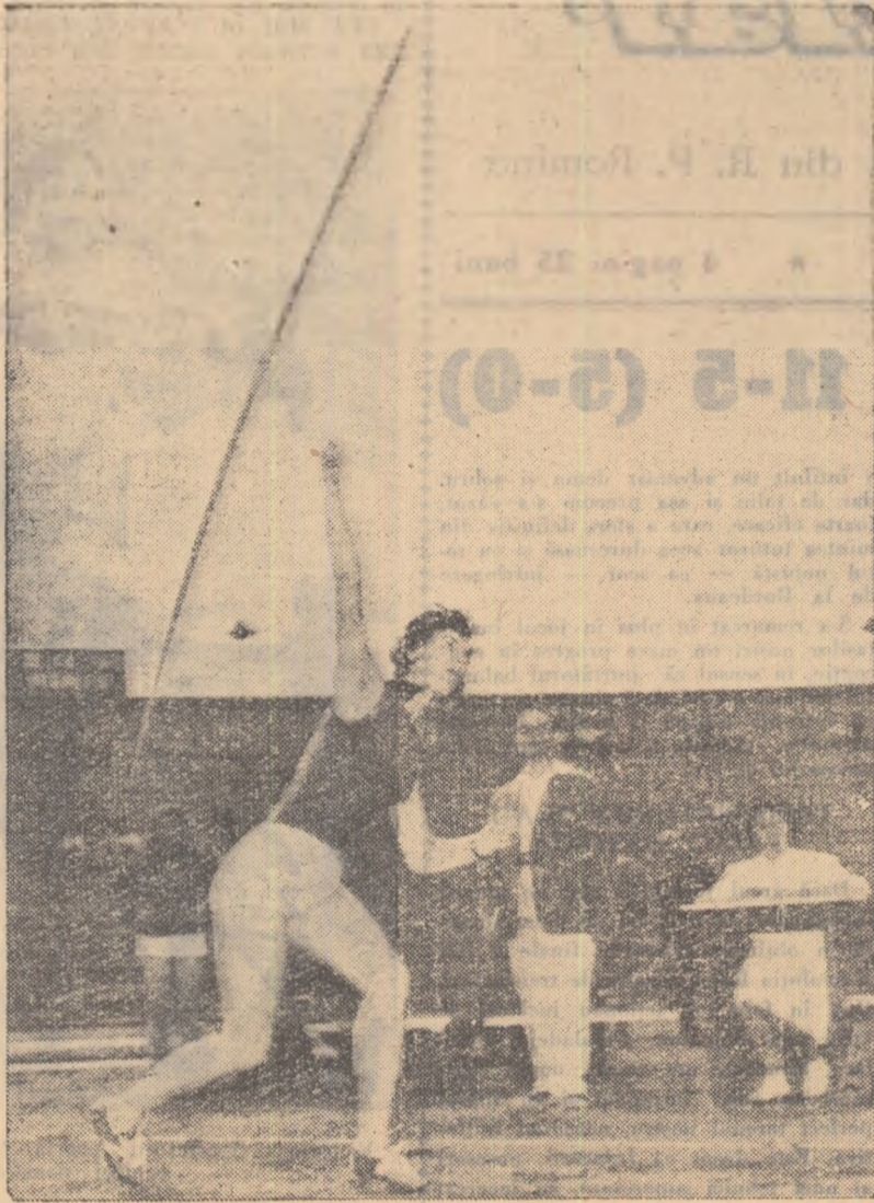
O fotografie istorică! Sulița lansată de Elvira Ozolina se va opri la 59,55 m. Nou record al lumii

bunți performenți ai lumii. Așa cum era de așteptat, întrecerea a prilejuit o luptă interesantă, dominată de duelul dintre alergătorii Papavasiliu și Sokolov. După primele ture în care a condus Hecker, acesta a cedat inițialiva cuplului Papavasiliu — Sokolov, urmat îndeaproape de reprezentan-