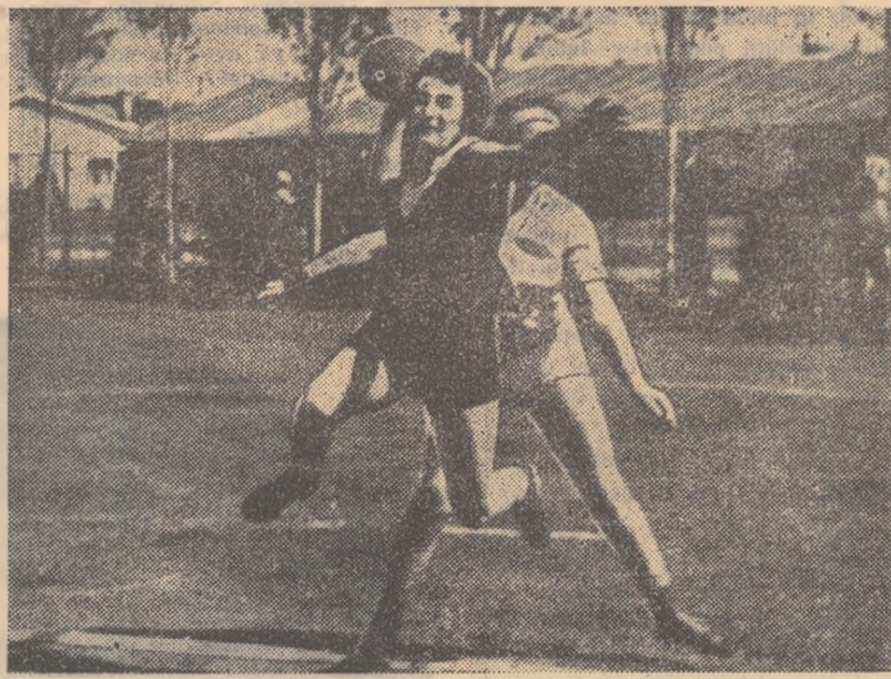
Fază din meciul Cetatea Bucur — Constructorul Timișoara.

În campionatul masculin de categoria B s-au înregistrat următoarele rezultate: C.S.U. București-Dinamo Tg. Mureș 21-12 (6-6); Victoria Bacău-Recolta Hălchiu 8-8 (3-4); Stăruința Odorhei-Balanța Sibiu 15-11 (8-6); Textila Cisnădie-C.S. Marina Constanța 11-6 (6-1); I.C. Arad-Voința Sighișoara 7-7 (4-4).