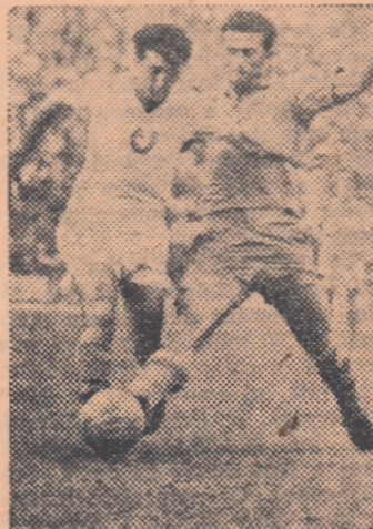
Interul stînga Zavoada I în luptă pentru balon cu extremul dreapta Blujdea, care se îndreaptă spre poarta lui Voinescu. (Fază din meciul C.C.A. — Progresul București 4-1).

De joi pînă duminică nu sînt decît 3 zile, timp în care nu prea se pot întîmpla minuni în materie de fotbal. Și totuși, iată că a fost posibil ca același C.C.A., care joi 27 septembrie obținuse o victorie la scor (6-0 cu Energia Minerul Petroșani) să incline steagul în fața unei echipe pe care în tur o învinsese „acasă” cu 8-0. Meciul cu Progresul București se anunța fără doar și poate mult mai dificil. Or, ați aflat din ziarele de ieri ce s-a întîmplat: C.C.A. a cîștigat cu un scor categoric (4-1).