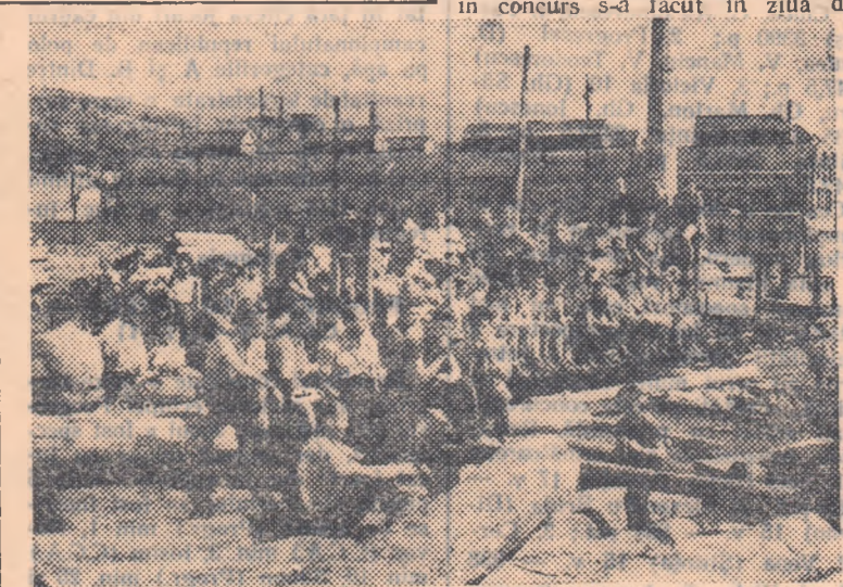
Punctul de adunare a concurenților a fost la B.T.E. Petroșani. Din Petroșani, concurenții au plecat la cabana Lonea, punctul de pornire în concurs, cu decolavul. În foto grafic: concurenții s-au îmbarcat spre a pleca la cabana Lonea.