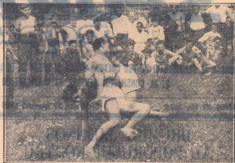
Trînta este un sport foarte răspîndit la sate. Iată aci un aspect de la o aprigă dispută.

Duminică de duminică, sau în oricare altă zi de sărbătoare, zeci de tineri și tinere din această comună își dispută înțietatea pe diferite terenuri de sport. Cele trei echipe de fotbal ale colectivului sportiv, echipele de volei, cele de popice, atleții sau șahiști au mult „de lucru” la fiecare sîrșit de săptămînă așa că luna seara, în fața difuzoarelor, țărani muncitori din comuna