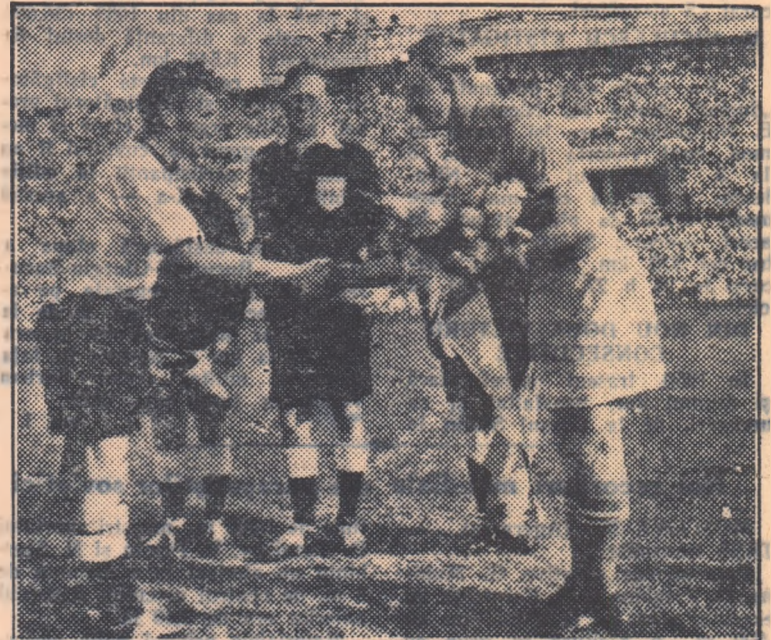
Înainte de începerea meciului căpitani celor două echipe schimbă tradiționalele fanioane. În foto: în stînga Fritz Walter (R. F. Germană) și I. Netto (Uniunea Sovietică).