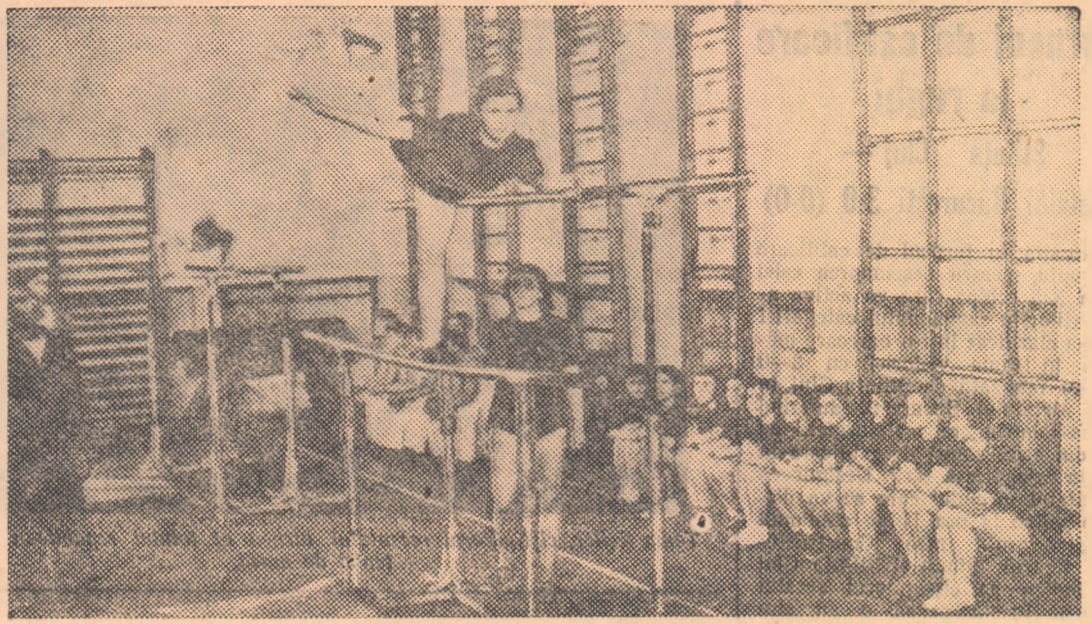
Exclusă în trecut de la viața publică și socială a țării, jemeia albaneză se bucură acum de drepturi egale cu ale bărbaților. Lucrul acesta se vede și din numărul tot mai mare de femei și fete care iau parte la activitatea sportivă.

Alături de masele muncitoare din R.P. Albania, sportivele și sportivii țării împlinesc cea de a zecea aniversare a eliberării patriei lor cu noi succese și realizări, cu noi angajamente luate în fața poporului.