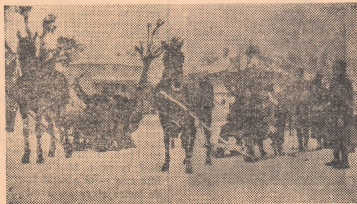
Tinerii țărani muncitori din Zărnești se întrec în cadrul Spartachiadel de iarnă a satelor în concursul de sîniuțe.

În general, în buna organizare și desfășurare a întrecerilor din cadrul Spartachiadei de iarnă a satelor un rol important îl vor avea profesorii de educație fizică, învățătorii și instructorii obștești care au sarcina de a sprijini și de a îndruma concurenții în perioada de pregătire și de a ajuta la desfășurarea tehnică a concursurilor.