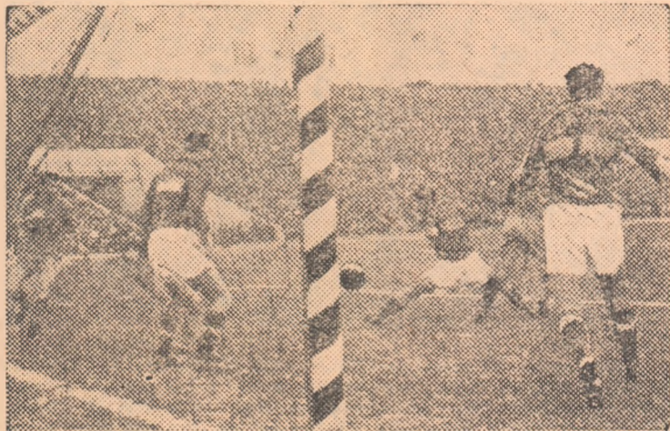
C.C.A. și Locomotiva Grivița Roșie — care joacă mine în sferturile de finală ale Cupei R.P.R. — s-au întâlnit și anul trecut în semifinalele acestei competiții. Iată o fază din acea partidă: în fața porții echipei feroviare, apărarea Locomotivei Grivița Roșie luptă cu înaintarea echipei C.C.A.