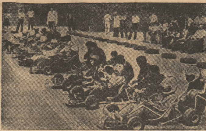
Secvență din pasionanta întrecere a karturilor...