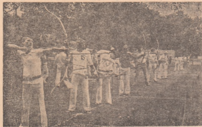
Un aspect de la întrecerile arcașilor participanți la „Concursul Prietenia”