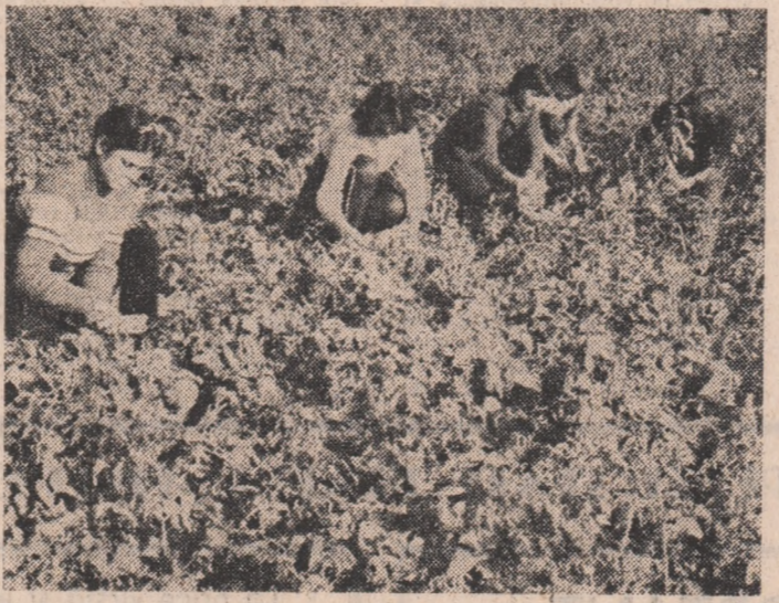
MIRCEA BORDA (Continuare în pag. a III-a)