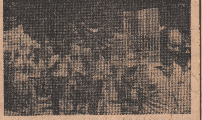
Numeroși cetățeni americani se pronunță cu hotărîre împotriva cursei inamurilor, a programului S.U.A. de militarizare a spațiului cosmic...