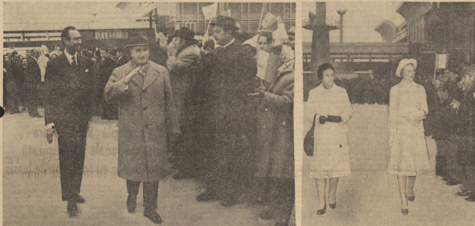
Momente semnificative ale primirii călduroase la sostră în Capitală

ieri au sosit în țara noastră într-o vizită oficială Alteța Sa Regală Marele Duce Jean al Luxemburgului împreună cu Marea Ducesă Josephine Charlotte