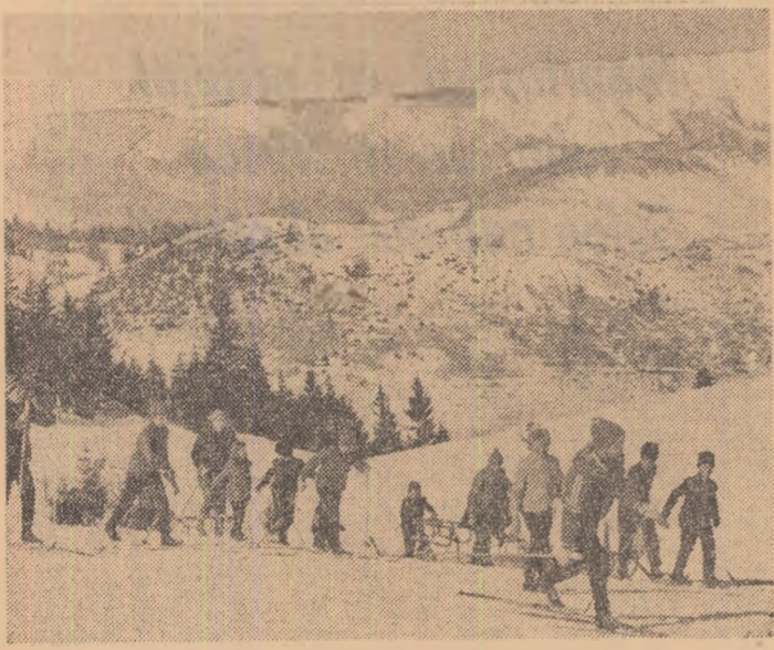
Cititi în pagina a V-a, relatări de la corespondenții noștri privind acțiunile și activitățile sportive de masă organizate de organele și organizațiile U.T.C.