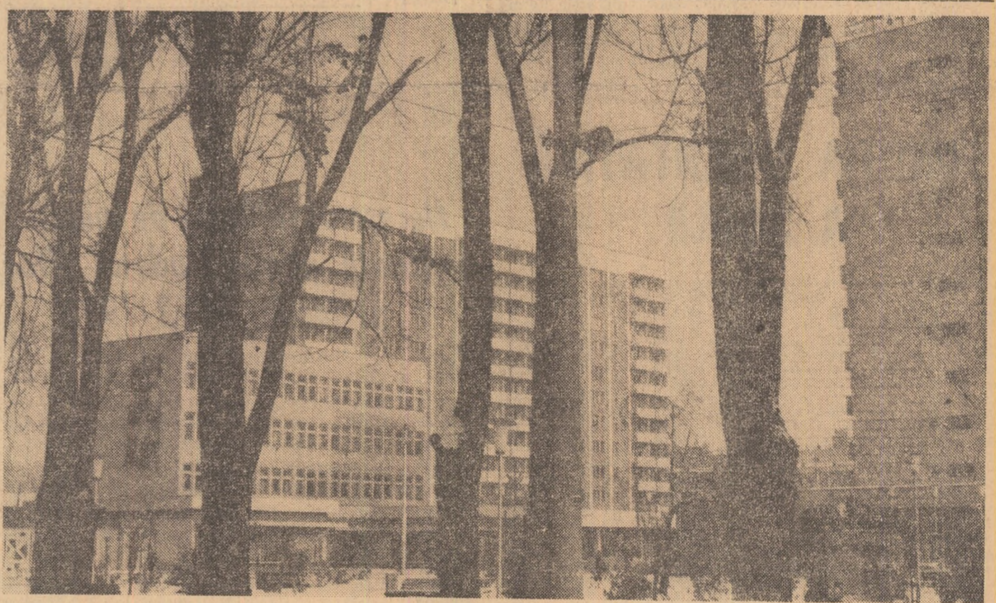
În noul centru al orașului Miercurea Ciuc.