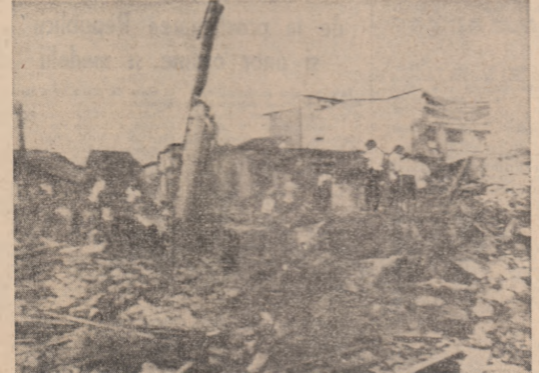
După dezastrul seismic de la Managua, capitala nicaraгуiană a fost transformată, în cea mai mare parte, într-un morman de ruine

După cum se știe, „războiul codului” a fost declanșat ca urmare a refuzului pescadoreanilor străine, îndeosebi britanice și vest-germane, de a se conforma hotărîrii guvernului de la Reykjavik privind extinderea limitelor apelor naționale de la 12 la 50 mile. Oficialitățile islandeze au motivat această măsură prin aceea că pescuitul ocupă un loc esențial în economia țării.