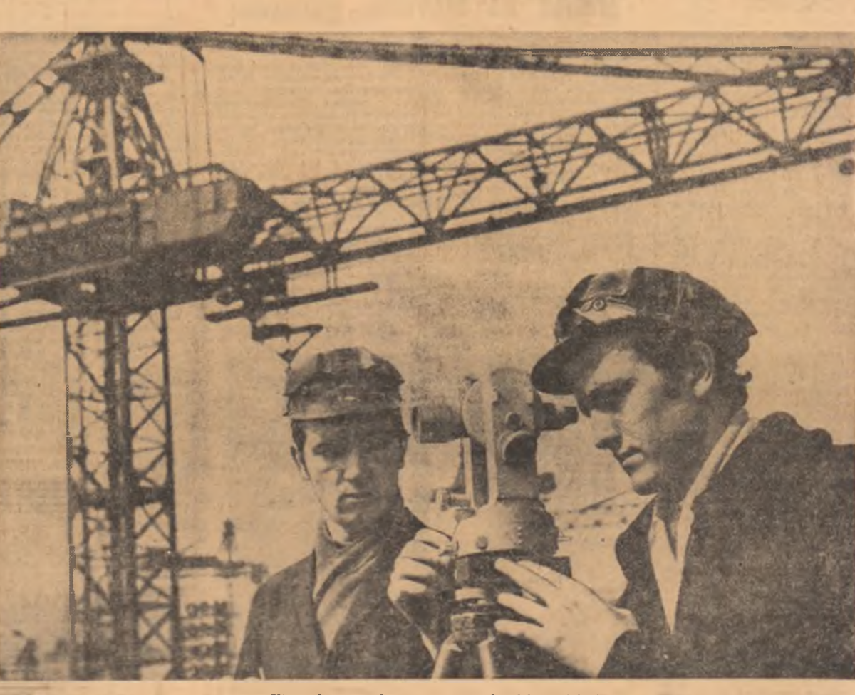
Viitoarele trasee ale Dunării, prin lentilele teodoliturii.

Cu toate acestea împasul în care se află de multă vreme respectivul aspect al activității pe multe șantiere, n-a fost depășit, plătindu-se în continuare tribut formalismului și muncii de mîntuială. Se poate afirma că în prea puține întreprinderi de construcții dintre cele amintite există o preocupare cît de cît serioasă în această privință, cu rezultate certe. Mulți dintre directorii de întreprinderi, șefii de șantiere, președinții comitetelor sindicale, secretarii organizațiilor U.T.C., și-au învins în schimb un adevărat talent în a explica de ce nu se poate pune la punct, în sfîrșit, această problemă. Pe de altă parte, pot fi deosebit de interesantă și de edificatoare, din punct de vedere profesional, discuțiile cu tinerii care raportează cu adevărat satisfacție, organizarea unui număr de atîtea cursuri de ridicare a calificării,