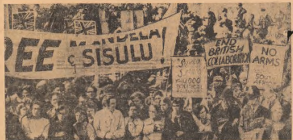
Demonstrație la Londra împotriva apartheidului din Africa de sud

LUPTA DEOSEBIT DE violente la care au participat unități de aviație, artilerie și tancuri au avut loc săptămîna trecută în partea de nord a Irakului între trupele armatei irakiană și unități militare ale minorității kurde, anunțată postului de radio kurde, citat de agenția U.P.I. Unitățile militare ale generalului Barzani, afirmă postul de radio, au respins oferta de armare a trupelor irakiană de la Bagdad. Pozițiile ocupate de trupele generalului Barzani au fost atacate de două brigăzi ale armatei irakiene susținute de