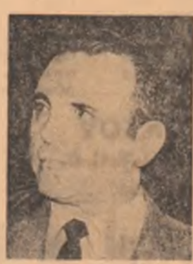
GALA A X-A