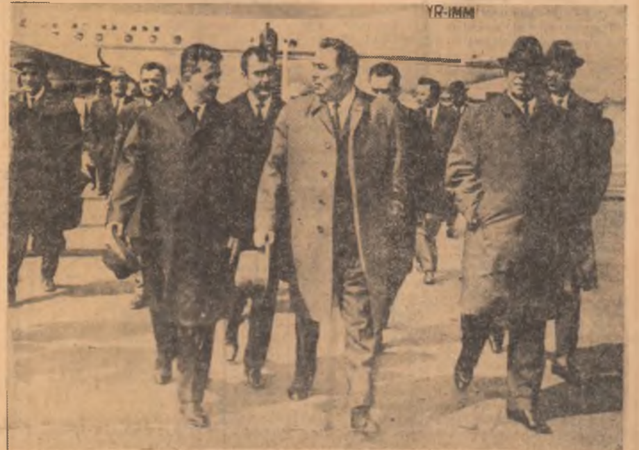
La sosit, pe aeroportul Vnukova