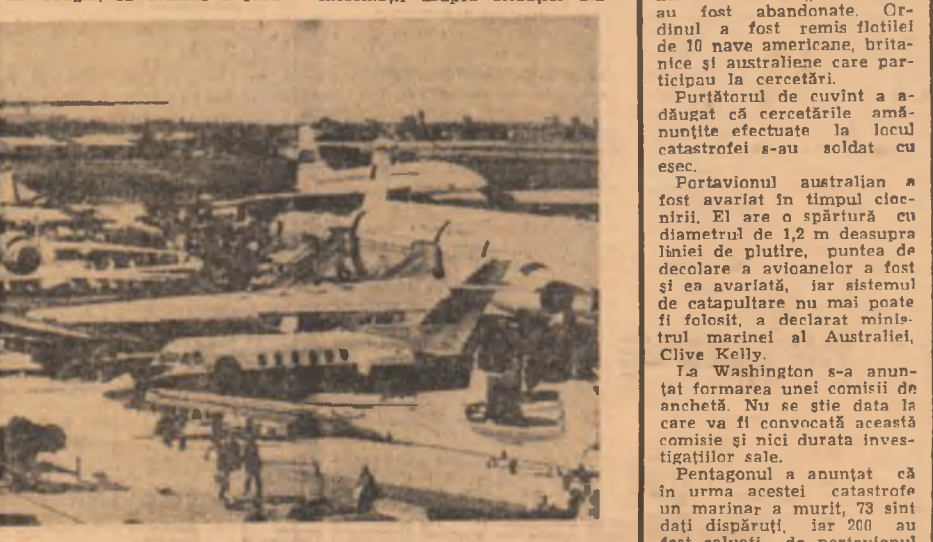
FRANȚA. La Bourget s-a deschis Salonul aeronautic internațional. Fotografia noastră înfățișează o imagine de ansamblu

La Washington s-a anunțat formarea unei comisii de anchetă. Nu se știe dacă la care va fi convocată această comisie și nici durata investigațiilor sale.