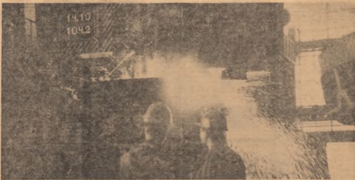
Oțelăria Combinatului sider- urgic „Colăți”. Se toarnă o nouă sarje laborată în uria- șul convertizor al oțelării.

● IN ÎNTÎMPINAREA Congresului partidului și a celel de-a 25-a aniversări a eliberării patriei, colectivele unităților industriale din judetul Hunedoara au avut deplină planul la producția globală valorică cu 54.408.000 lei. La producția marfă vîndută și încașată, realizările suplimentare se cifrează la 73.739.000 lei. Unitățile industriale din judet au dat pînă acum, peste prevederile planului, 18.570 tone de cărbune, peste 20.000 tone de fontă, 12.276 tone de oțel, 7.000 mc de cherestea și bușteni, 6.913 mp placaj de marmură și alte produse. Industria județului a exportat în perioada care a trecut din acest an produ- se și mărfuri în valoare de peste 290 milioane lei, depă- șind cu aproape trei la sută prevederile contractuale. (Agerpres)