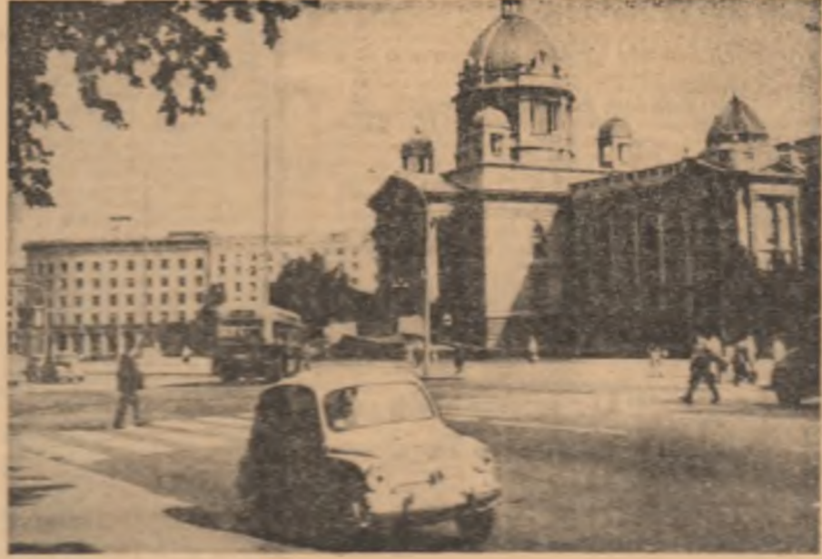
R. S. F. IUGOSLAVIA. Imagine din Belgrad, capitala țării

Referindu-se la situația din Orientul Apropiat, primul ministru al Sudanului a declarat că guvernul său consideră problema palestiniană drept cea mai importantă problemă arabă, căreia este necesar să i se acorde atenția cuvenită.