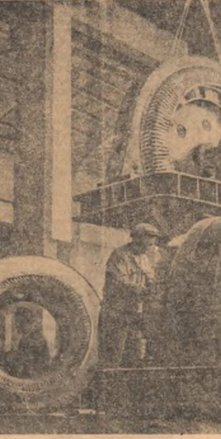
R. P. D. COREEANA. Aspect de muncă la Uzina de motoare electrice din Daian

În urma reuniunii de miercuri a Consiliului național al securității, președintele Argentinei, Juan Carlos Onganía, a ordonat armatei să-și asume răspunderea pentru menținerea ordinii în întreaga țară. Această măsură a fost luată după ce Confederația Generală a Muncitorilor din Argentina a chemat la o grevă generală de 24 de ore pentru vineri. Pe întreg teritoriul țării vor fi instituite curți marțiale, care vor judeca de urgență pe toți cei care vor tulbura ordinea publică. Trupele armatei terestre, marinei și forțelor aeriene vor fi puse la dispoziția guvernatorilor provincilor pentru a menține ordinea.