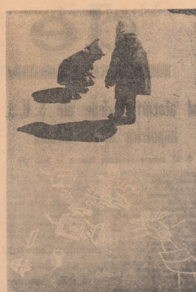
Expoziție în aer liber