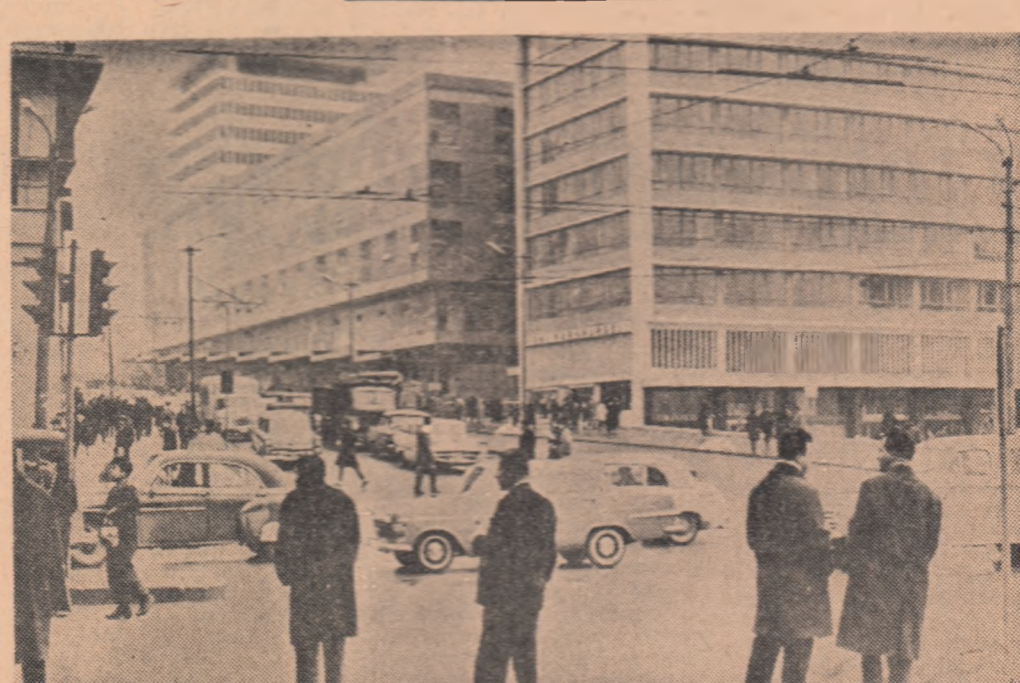
WILSON VA SOSI LA WASHINGTON

LONDRA 5 (Agerpres). — La Londra s-a anunțat că primul ministru britanic, Harold Wilson, intenționează să plece la 13 aprilie la New York și Washington unde va avea întrevederi cu secretarul general al O.N.U., U Thant, și cu președintele S.U.A., Lyndon Johnson. Agențiile de presă informează