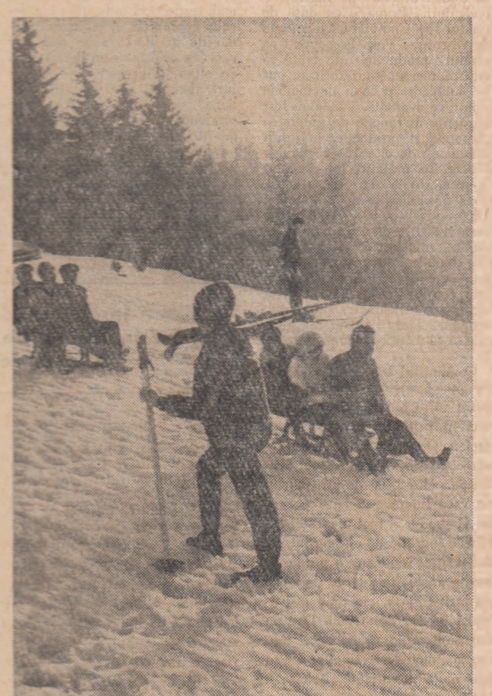
La Poiana Brașov, zăpada căzută din belșug atrage zilnic sute de tineri.

Muncitorii, inginerii și tehnicienii de la unitățile textile „Dacia” — București, „Testona” — Iași, „Tebsa” — Arad, „Tirnaș” — Medias, precum și din celelalte întreprinderi de prelucrare a bumbacului extind tehnologiile moderne de lucru. Prin aplicarea unor procedee tehnologice noi, se realizează cantități însemnate de țesături cu sfinabilitate redusă, țesături satinate de bumbac în amestec cu celuloză și cu fibre sintetice. Experimentarea înlocuirii firelor de urzală cu produse sintetice, folosirea aparatelor superioare pentru țesături din bumbac și în amestec, introducerea tehnologiei de alore constantă cu aplicabilitate, vor permite obținerea din aceeași ramură și obținut noi rezultate în îmbunătățirea calității țesăturilor. În acest an se vor realiza cu 30 la sută mai multe țesături din fire fine, față de cantitatea obținută anul trecut. Colectajul din anul acesta, care s-a încheiat cu 190 articole noi de bumbac, prezintă o gamă variată de țesături din fire fine, în amestec cu fibre chimice și celuloză. Noile experimente sînt realizate în 248 lozane în cîte 5—7 posturi tehnologice fiecare. (Agerpres)