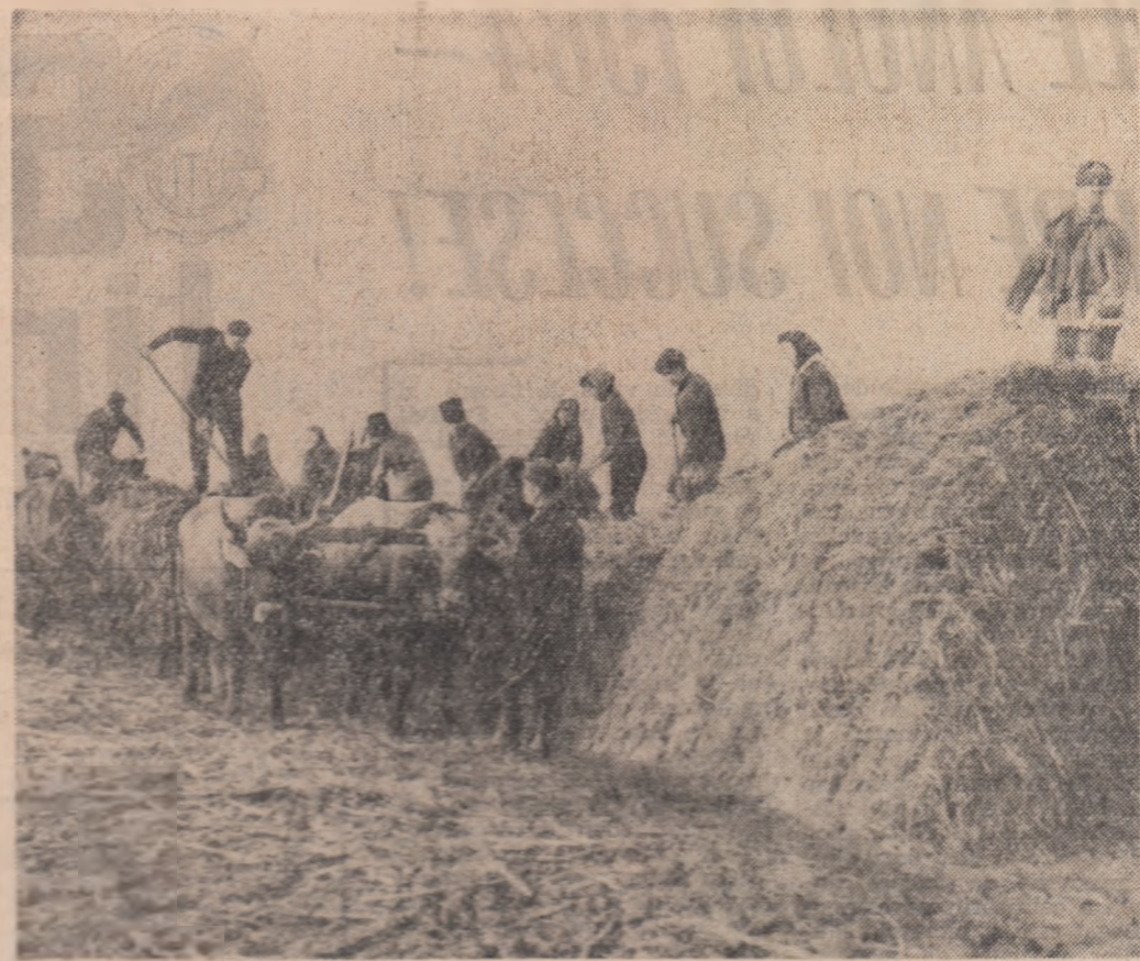
Una dintre acțiunile importante ale organizației U.T.M. din cooperativa agricolă de producție din comuna Săscăuț, regiunea Argeș, este amenajarea tinerilor (tineri) cooperatori la transportul și depozitarea în câmp, în pășuni, a îngrășămintelor organice de îngrășămintele organice în grădini. Se amenajează cea de-a zecea plată de muncă.

CONSTANȚA. — (de la corespondentul nostru): Primăvara dă semne evidente și aceste este un motiv în plus de grabă pentru cei care pregătesc vesmintul floral al sărbătorii. De aceea, în aceste zile, în serale și răsădările oaze, la casele de la Eforie Nord și Comana se lucrează intens. Pîrăcun s-au semănat begoniile, săbiile și nemurtoarele albe soarelui și plante ornamentale. Din florile semănaute mai timpuriu s-au reculat deja 100.000 lire. Anul acesta, pe zona ornamentarea litoralului, se vor produce aici 1.500.000 de flori în 25 de varietăți de mîștă și cîtor diferite. Pentru scîlăzirea răsădurilor, înainte de plantare, s-au amenajat răsădări încălzite pe o suprafață de 4.000 m.p. Printre noțiunile florale ale viitorului sezon estival se numără și 120 de palmieri, alții acum în sed, din care o parte au înflorit în plin faur. NICOLAE BARBU