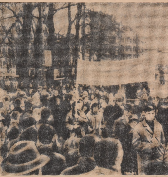
OLANDA: Aspect de la o recentă demonstrație care a avut loc la Amsterdam. Cei 10.000 de participanți au protestat împotriva creării F.N.M.

Primul Congres al Organizației Naționale a studenților ghanezi, care și-a încheiat lucrările în localitatea Vinnebe, a adresat un mesaj tuturor organizațiilor studențești din lume, îndemnându-le să acorde sprijin luptei populare pentru eliberare națională, pentru lichidarea definitivă a ultragiilor colo-