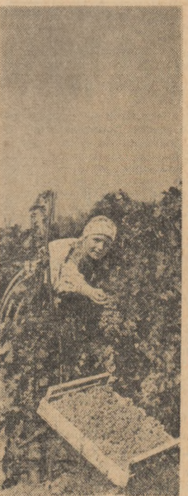
La cules de struguri în podgoria Panziu din regiunea Galați.