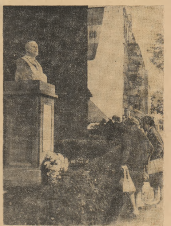
În fotografie, bustul lui Ion Luca Caragiale în fața bibliotecii cu același nume din Berlin

În cadrul expoziției s-a prezentat o serie de produse realizate de artizanii din țările participante, care au fost prezentate în cadrul expoziției.