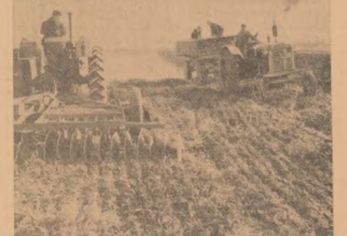
Se împrăștie îngrășămintele chimice pe ogor. La G.A.S. Bragadiru, regiunea București, se dă o atenție deosebită lucrărilor de fertilizare a pămînturilor. Pînă în prezent au fost încorporate în sol îngrășămintele chimice pe o suprafață de 890 ha. și îngrășămintele organice pe o suprafață de peste 100 ha.