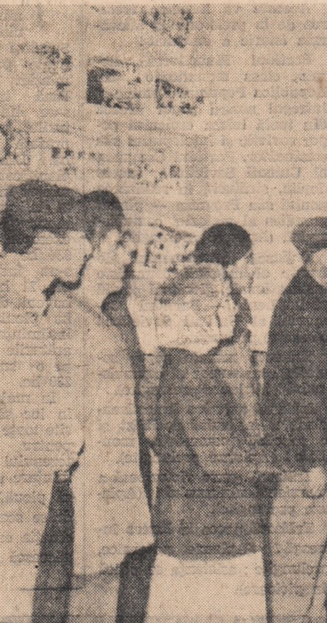
Și ei vor fi milne colectivisti!

...iar biblioteca comunală, cu bogatul ei fond de cărți îi are destul de des oaspeți. La 650 familii — 758 cititori în-