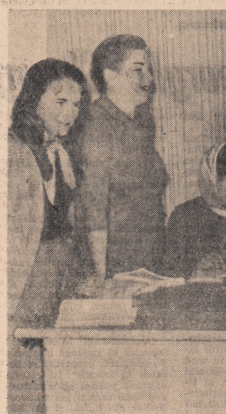
În programul pe care brigada artistică de agitație îl repetă acum, sînt popularizați cei care au făcut cerere de înscriere în gospodăria colectivă.

țărăniții noastre spre gospodăria colectivă. Mai apoi, cînd organizația U.T.M. i-a mobilizat pe tineri la strîngerea recoltei de furaje de pe terenurile comunale, printre cei aflați la muncă patriotică a poposii și bibliotecara comunală care a organizat cu acel prilej prezentarea și lectura unor fragmente din broșura „Dăunătorii plantelor de nutreț și combaterea lor”, în care se arăta că gospodăria colectivă are posibilități superioare de asigurare a unei baze furajere îndestulătoare pentru un septel în continuă creștere. Lecturi în grup cu tineri, la locul de muncă, se fac la Negrești oriunde și ori cînd se înveste prilejul; ei au asistat și la citirea unor broșuri care popularizează cele mai bune gospodării colective din regiunea Bacău.