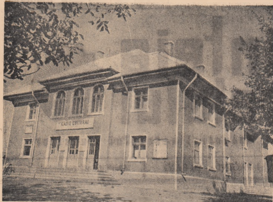
Căminul cel nou — împunător centrul cultural al comunei Negrești.

Călătorile care, grăbit de treburi, gosește pe panglica de asfalt, nou-nouă, dintre Piatra și Tg. Neamț, își propun să intruți — nu prin mlaști și nu fără folos — în așezarea numită Negrești. Veți vedea acolo o dovadă grăitoare a avântului satului nostru nou, socialist, către cultură: clădirea împunătoare a căminului cultural, cu etaj, cu sală de spectacole și încăperi bine mobilate pentru studiu, pentru repetiții, pentru bibliotecă. Totul — de la prima cărămidă a zidurilor înalte, și pînă la ultimul scaun din sala de spectacole — este rodul contribuției țăranilor — tineri și vîrstnici — dintre care o bună parte au pornit, cu aproape doi ani în urmă, pe calea gospodăriei colective; este totodată oglinda bunăstării acestora, a cîrnelor lor mereu sporite de cultură.