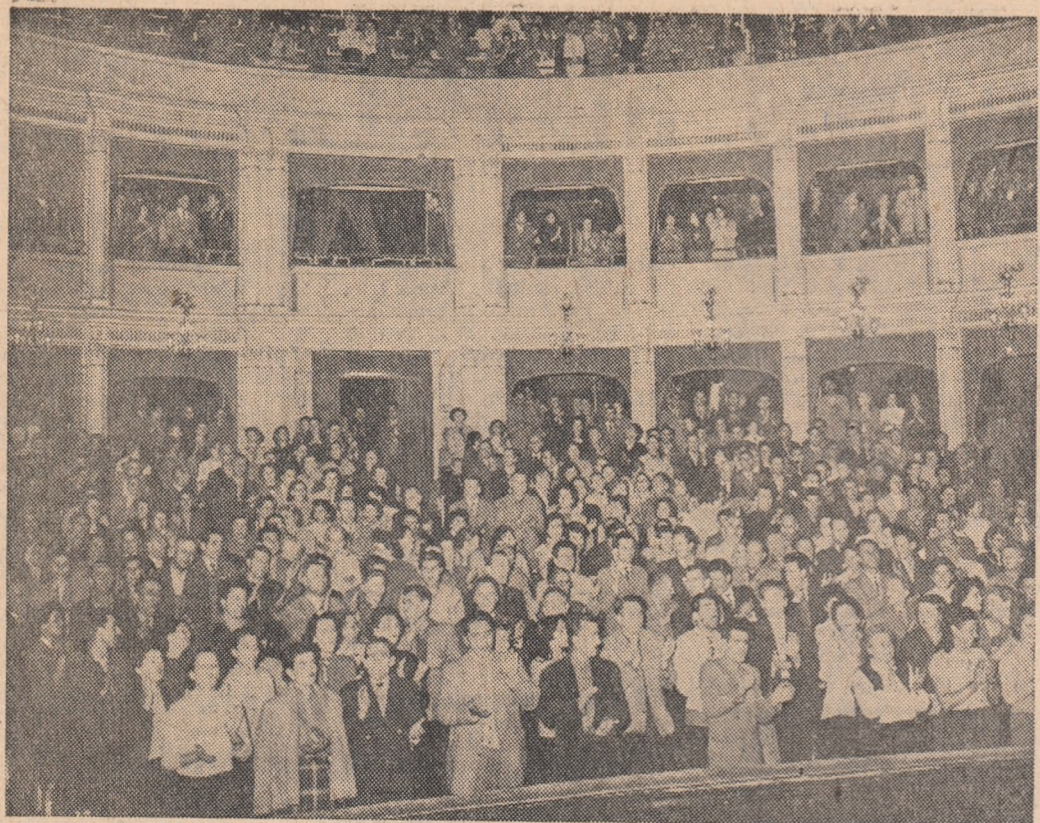
Un aspect din sala Teatrului de Operă și Balet în timpul mitingului oamenilor muncii din raionul Lenin din Capitală, consacrat lucrărilor Congresului al XXII-lea al P.C.U.S.