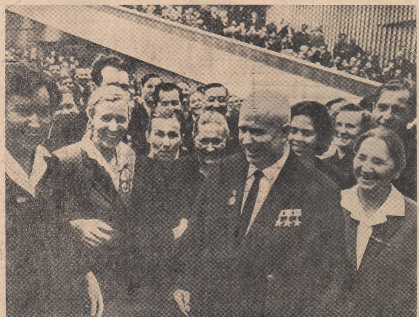
N. S. Hrușciov printre delegații la Congres.