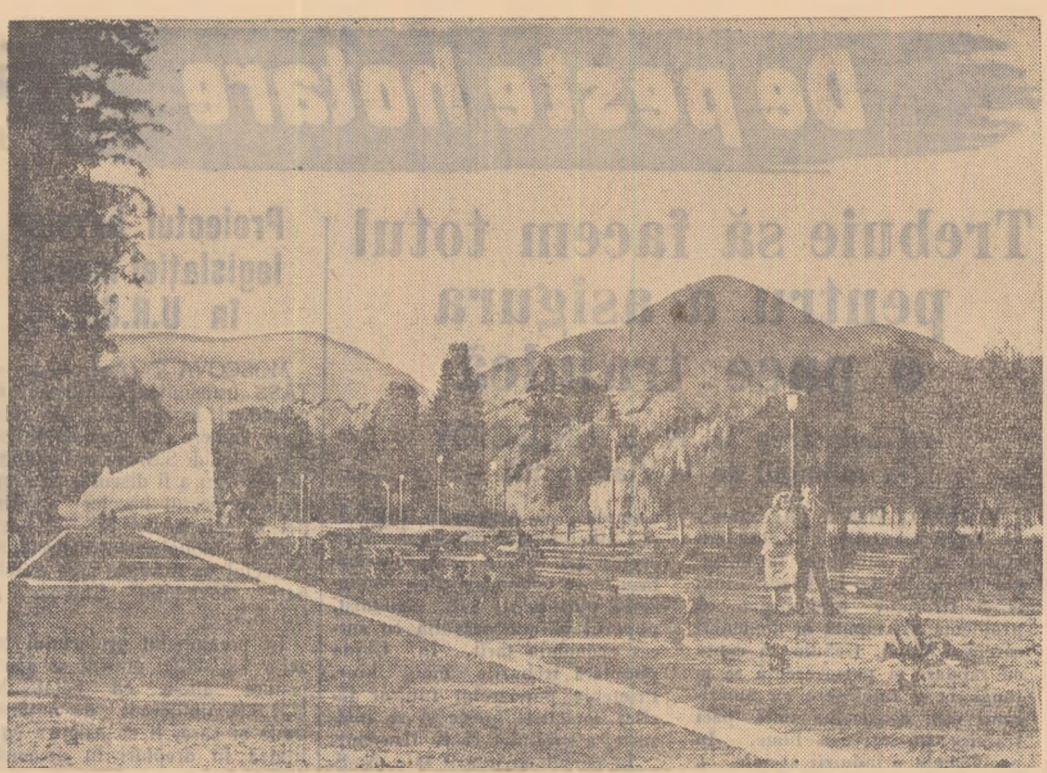
Parcul din orașul Baia Mare, amenajat aproape în exclusivitate prin munca patriotică a brigăzilor utemiste de muncă patriotică.

Același îndemn: multă lectură pentru a înțelege mai bine ce e poezia.