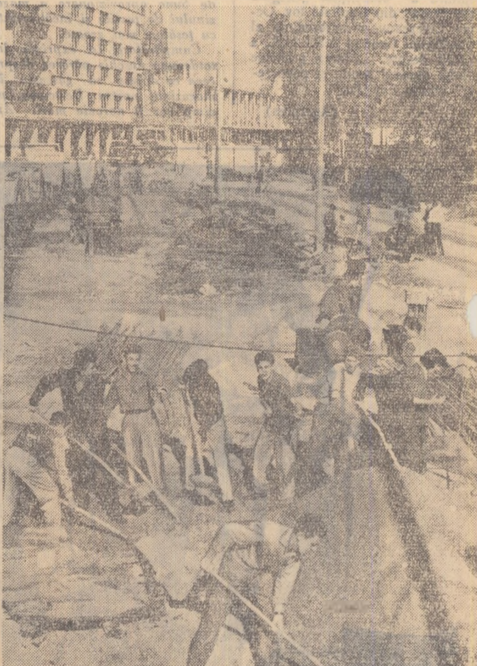
Elevii Școlii medii nr. 1 din București. Încadrați în brigăzile de muncă patriotică, își petrec numeroase ore muncind pe șantierul de construcții din Piața Republicii.