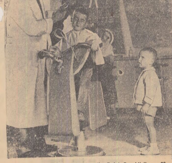
La frizeria copiilor „Giuhulei” din B-dul Republicii nr. 23.