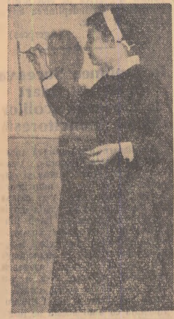
În Școala medie nr. 6 din București s-a înțrăntit o întrecere între clase. În fiecare zi, elevii de serviciu, informează școala prin gravio, asupra mersului întrecerii care a cîpprinștrul colectivului școlar.