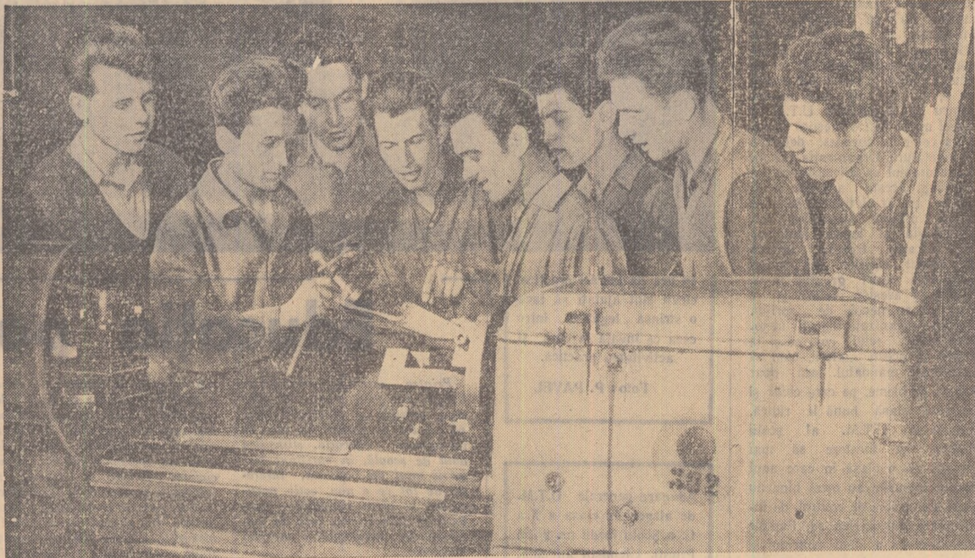
Brigada de tineret nr. 5 din secția strungărie a Uzinelor „Strungul”-Orașul Stalin este una din brigăzile fruntașe ale acestei întreprinderi. Membrii brigăzii își depășesc în mod permanent planul de producție cu 35-40 la sută. Iată-i în fotografie pe membrii acestei brigăzi discutînd despre confecționarea unei supape.