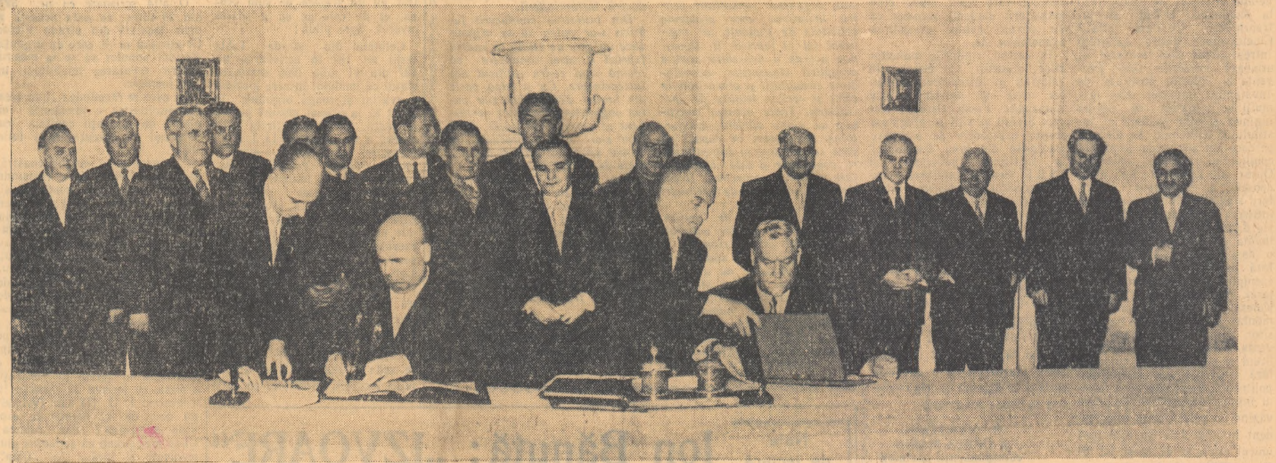
Semnarea Declarației cu privire la tratativele dintre delegațiile guvernamentale ale R.P.R. și Uniunii Sovietice.