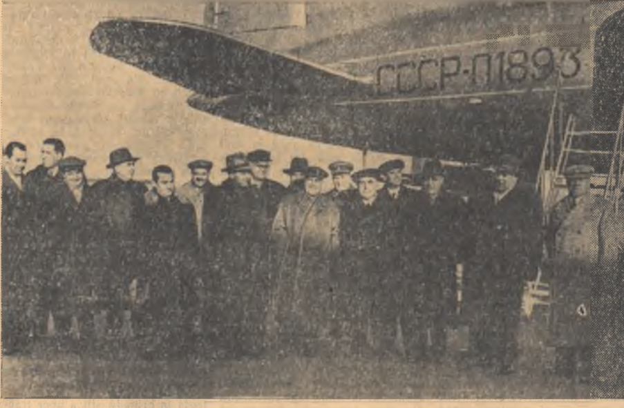
Delegația guvernamentală a R.P.R. la sosire, pe aeroportul Dăneasa

Colectivul uzinei constructoare de strunguri „Iosif Ranghel” din Arad a înținat zilele trecute Ministerul Industriei Metalurgice și Construcțiilor de Mașini de îndeplinirea planului anual la producția globală în mai puțin de 11 luni. Pentru constructorii de strunguri acesta este un mare succes, deoarece producția realizată reprezintă o creștere de 7 la sută față de anul trecut.