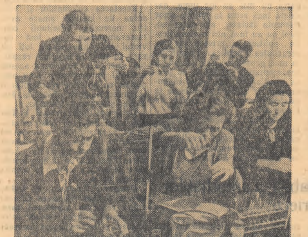
Elevii școlii de tineret muncitorească de pe lângă fabrica de rumești din Leningrad „Scorohod” la o oră de practică în laborator.

Cetățenii U.R.S.S. au dreptul la învățatură (articolul 121).