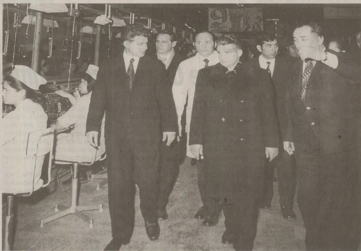
În timpul „vizitelor de lucru” în Capitală, Ceaușescu includea în „circuit” și întreprinderile de electronică

Nici facultatea nu era ușoară. „În anul 4 de facultate am dus la școală