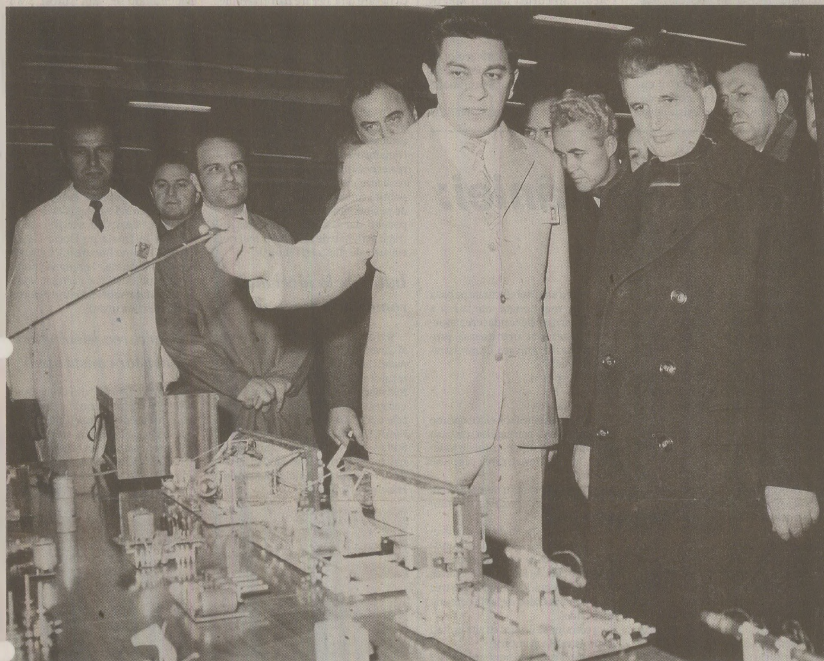
Industria electronică era printre cele mai profitabile ramuri economice pentru export. Angajații din acest domeniu primeau uneori sporuri între 15%-40% la salariu, în urma depășirii reale a normelor.

La Microelectronica râvneau toți șefii de promoție din toate facultățile de Electronică din țară. Atmosfera de elită, tineri foarte mulți și entuziaști, tehnologie de ultimă oră care se bătea de la egal la egal cu piața internațională de profil, pază militarizată, dar și plecări în străinătate cu duimulul.