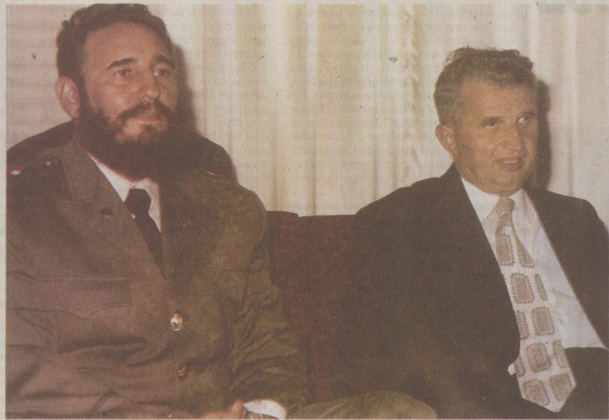
Ziaristii de la Europa Liberă socoteau că până și Fidel Castro era mai receptiv la reforme în blocul comunist decât Nicolae Ceaușescu

Faptul că Moscova a pierdut controlul asupra aliaților europeni și impactul tot mai mare al reformelor par a-l face pe Ceaușescu să se orienteze spre întărirea legăturilor cu toți adversarii reformei din lumea comunistă. Ceremoniile organizate la 16 iunie 1989 pentru reînnoirea fostului prim-ministru maghiar Imre Nagy au reprezentat pentru conducerea României, a Chinei, a Albaniei, a Cubei și a Coreei de Nord încă o prilej pentru a-și afirma atitudinea refractară față de reformele care au loc în Europa de Est și în Uniunea Sovietică: au boicotat ceremoniile. Absența lor sugerează posibilitatea unei noi constelații în cadrul mișcării comuniste. Deși, deocamdată, această grupare nu are o doctrină distinctă și un lider, mai mult dintre membrii săi proeminenți, de exemplu, Nicolae Ceaușescu, folosesc un limbaj strident pentru a-și apăra concepția despre socialism. De nevoie, Ceaușescu și-a sporit numărul contactelor cu omologii săi antireformiști. În afara numelui comun pe care îl reprezintă avertismentul față de reformă, văzută ca o amenințare la adresa rolului de conducător al partidului, apropierea lor s-ar putea baza și pe afinități personale. Rămâne de văzut dacă acestea vor duce la construirea unei strategii antireformiste coerente.