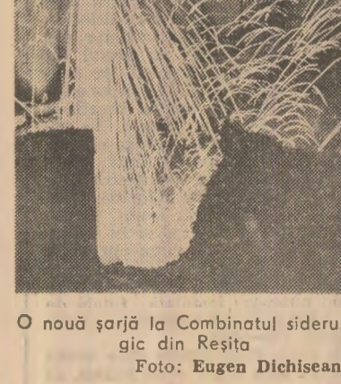
O nouă sîrjă la Combinatul siderurgic din Reșița.