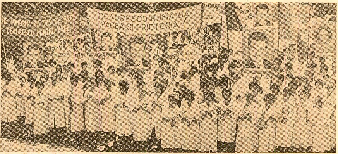
Aspect de la adunarea ce a avut loc la Institutul de cercetări chimice București

ADUNĂRI, MITINGURI, TELEGRAME ȘI MESAJE ALE OAMENILOR MUNCII DIN ÎNTREAGA ȚARĂ