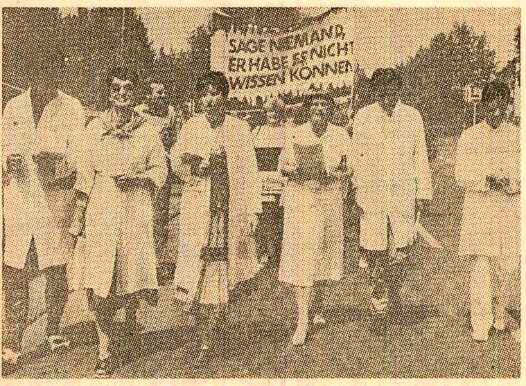
O demonstrație de protest a medicilor din orașul vest-german München împotriva pericolului unui război nuclear

consolidare a păcii și pentru dezarmare. Totodată, parlamentul suedez s-a pronunțat pentru interzicerea totală a armelor nucleare și intensificarea eforturilor vizând crearea unei zone denuclearizate în nordul Europei.