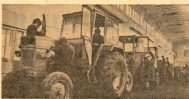
Prin bună organizare, la S.M.A. Holboacă, județul I. J., au fost reparate 80 la sută din tractoare.