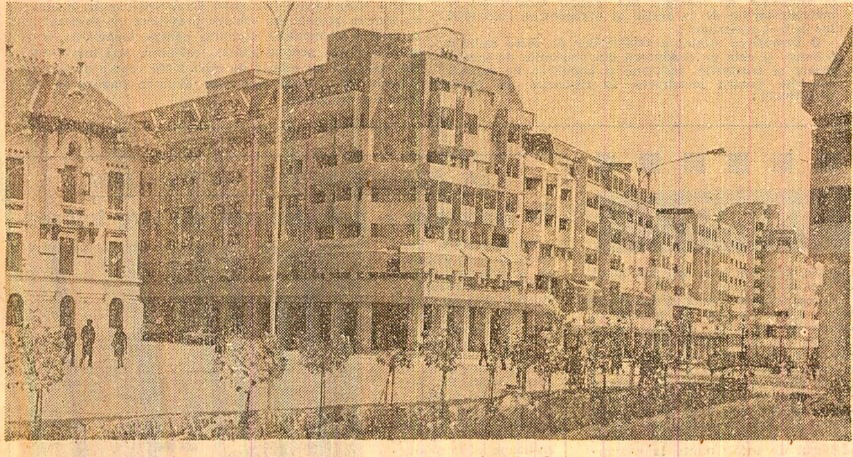
Din noile construcții ale municipiului Craiova