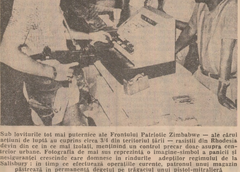
Sub loviturile tot mai puternice ale Frontului Patriotic Zimbabwe — ale cărui acțiuni de luptă au cuprins circa 3/4 din teritoriul țării — rasistiile din Rhodesia devin din ce în ce mai izolate, menținând un control precar doar asupra centrilor urbane. Fotografia de mai sus reprezintă o imagine-simbol a panicii și nesigurății crescânde care domnesc în rândurile adoptivelor regimului de la Salisbury: în timp ce efectuează operațiile curente, patronul unui magazin păstrează în permanență degetul pe trăgaciul unui pistol-mitrălieră

Fostul premier francez a subliniat că Tratatul de la Roma (semnat în martie 1957, prin care a fost constituită Piața comună) prevede crearea unei Adunări a comunității europene, și nu a unui parlament.