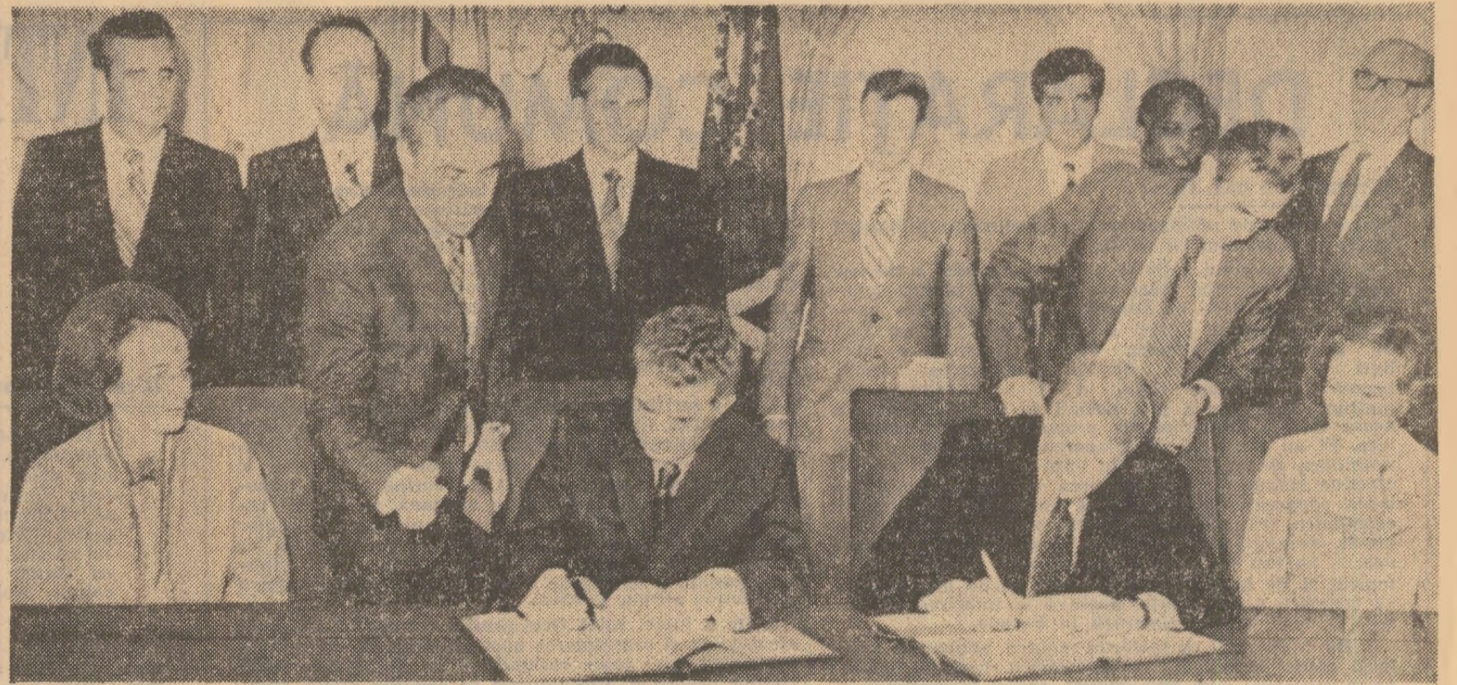
Un moment însemnat al vizitei: semnarea Declarației comune