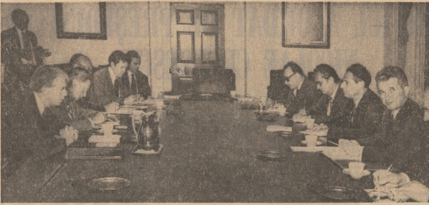
Dialog constructiv într-o atmosferă de înțelegere și stimă reciprocă