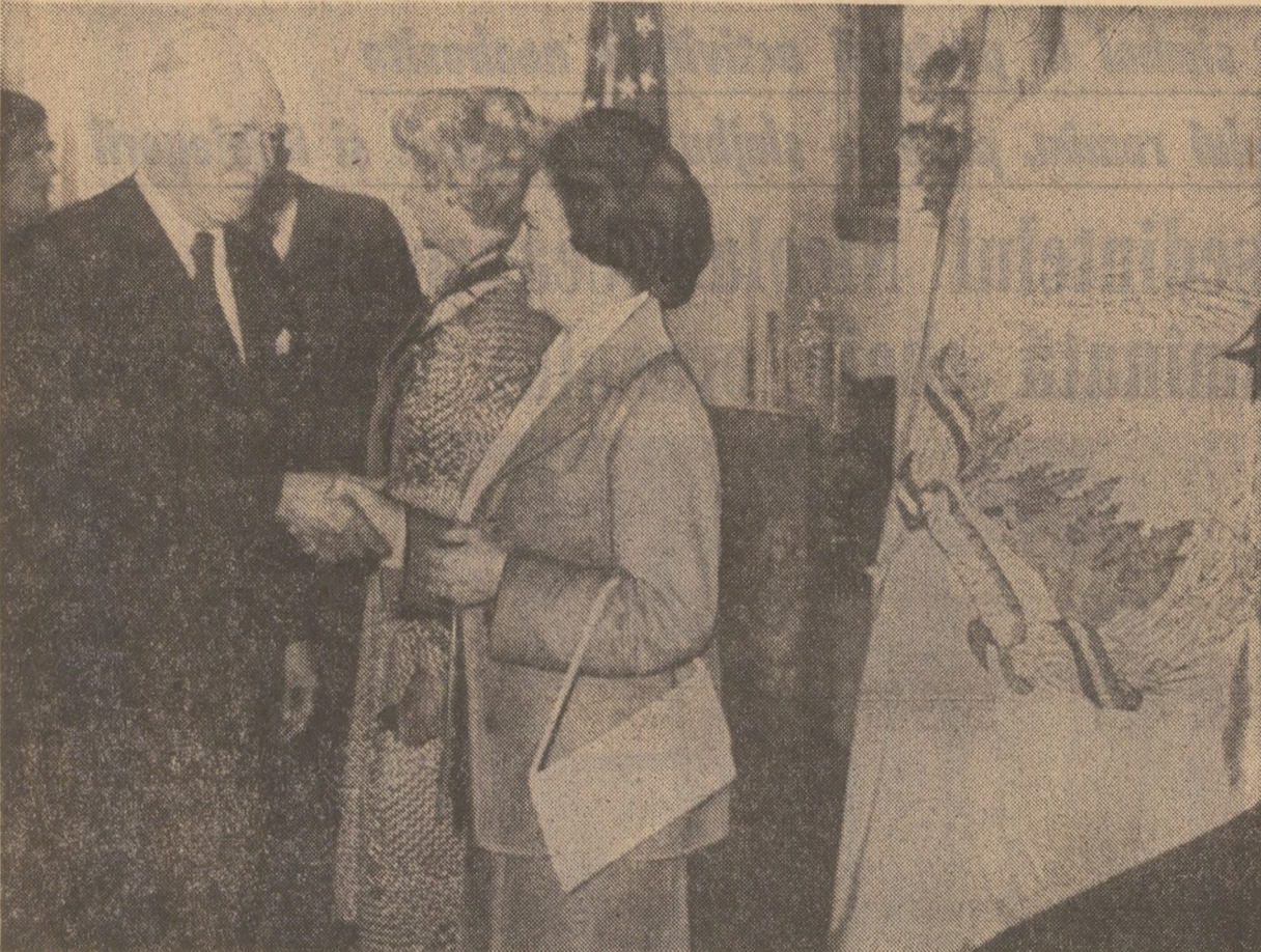
Cu prilejul dejunului oferit în onoarea tovarășei Elena Ceaușescu la Casa-muzeu de la Woodlawn Plantation, care a servit ca reședință primului președinte al Statelor Unite, George Washington

Au fost discutate probleme vizînd extinderea schimburilor comerciale dintre cele două țări și de adîncirea a cooperării tehnico-economice dintre firme americane și întreprinderi românești de comerț exterior.