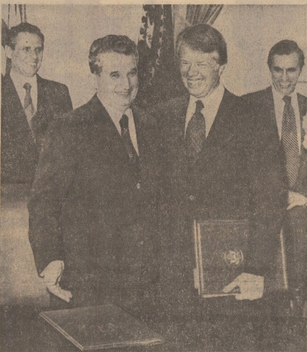
După semnarea Declarației comune — cei doi președinți se felicita cu cordialitate

Dialogul la nivel înalt româno-american, multiplele întâlniri și contacte cu personalități marcante ale vieții politice din S. U. A. pun în evidență prestigiul deosebit de care se bucură președintele României, politica constructivă, de pace și colaborare internațională a țării noastre