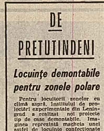
Locuințe demontabile pentru zonele polare

Încă din antichitate, iudul, piatră semiprețioasă de culoare verzuie, a fost utilizat la confecționarea obiectelor de poartă. Recent însă, în urma unor săpături arheologice făcute într-o localitate din apropierea Pekinului, s-a descoperit un șelci de femeie îmbrăcat într-o rochie din piatră de jad, cuștă cu fir de aur. Oamenii de știință apreciază că este vorba de veșminte de doliu, ce datează de acum două milenii.